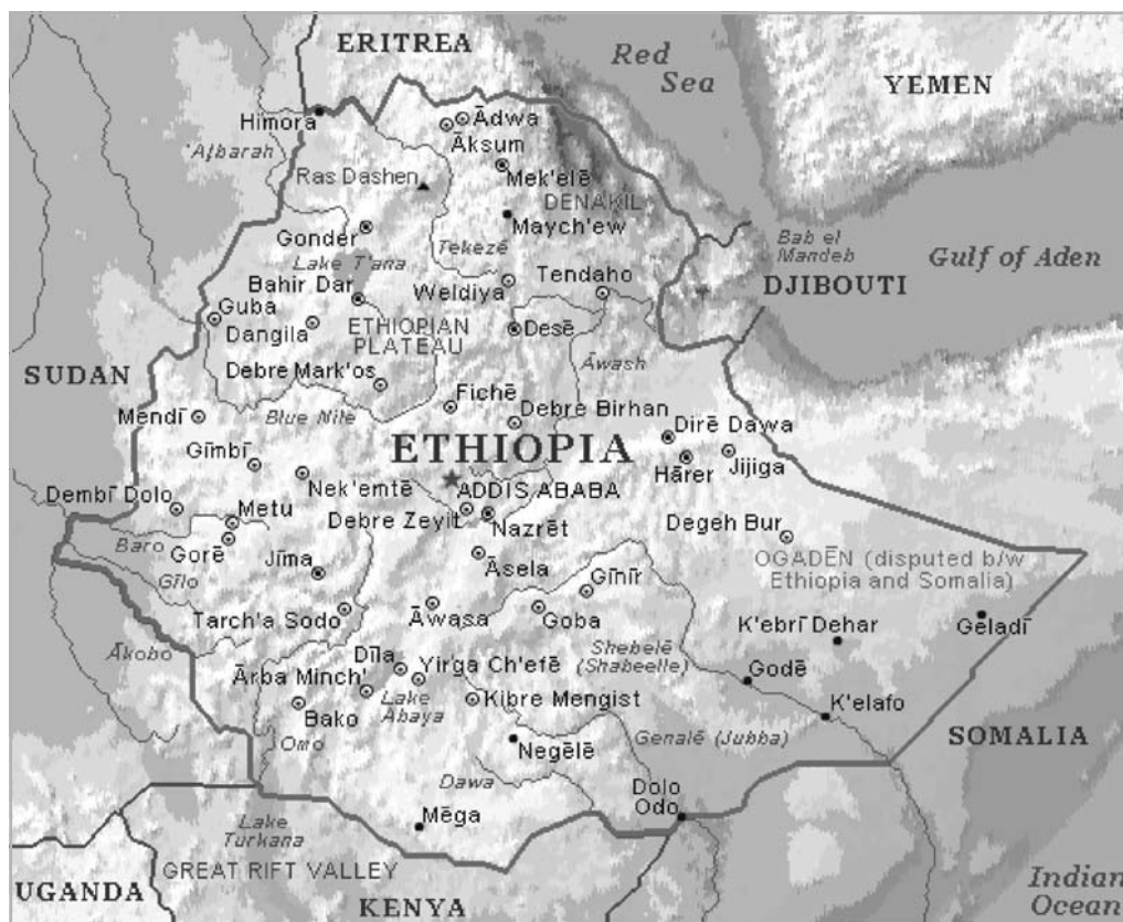
2. ÁBRA ETIÓPIA TERMÉSZETFDRAJZI TÉRKÉPE ÉS FŐBB TELEPÜLÉSEI

Egész Etiópia számára fontos az Awassa vize, amely nélkülözhetetlen áramforrás, és vizet szolgáltat a mezőgazdaság és ipar számára (pl. Wanji, Matahara stb. cukornád-, gyapot- és gyümölcsstermelő vidékein). Oromia egyedülálló vegetációja olyan növények eredeti otthona, mint a világszerte ismert kávé és valószínűleg itt ismerték fel elsőként a kávé serkentő hatását (Molnár, 2008). Ma is a kávétermesztés egyik központja.