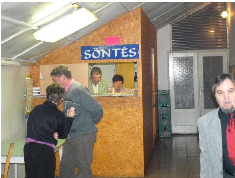
11. kép Az italmérés helyszíne a Rákóczi Népkörben.