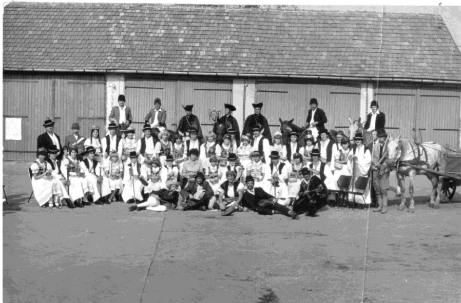
30. kép Szüreti felvonulók a Vörös Csillag Tsz udvarán 1982-ben.