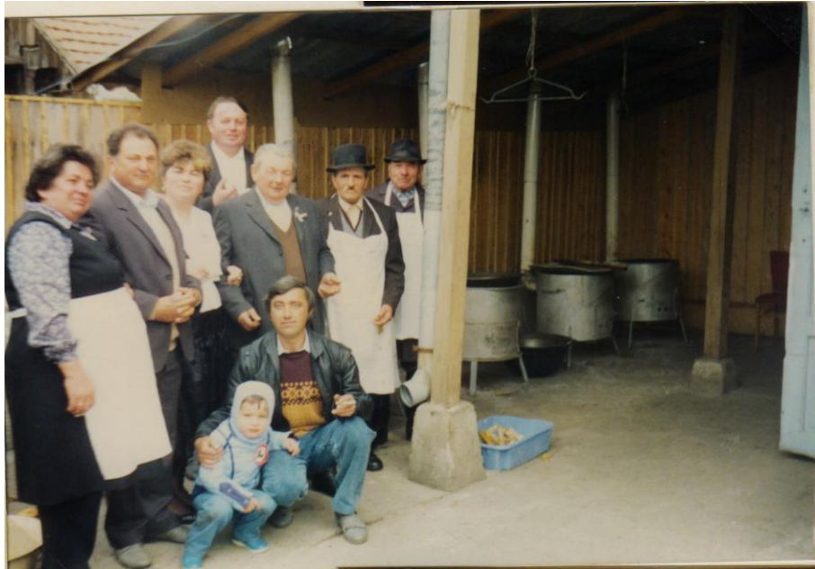
10. kép A „főzőmesterek” a 48-as Kör bankettjére készülődnek. Háttérben az üstházak sorakoznak.