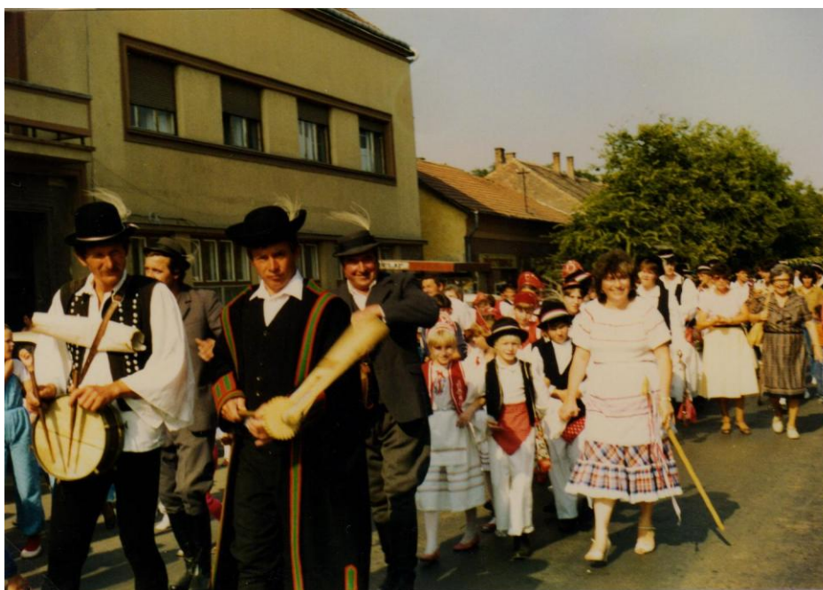
37. kép Szüreti menet a központban.