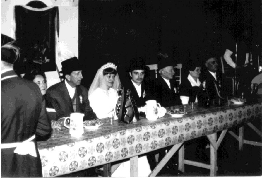
28. kép Násznép a Németfalusi Lakodalmásban.