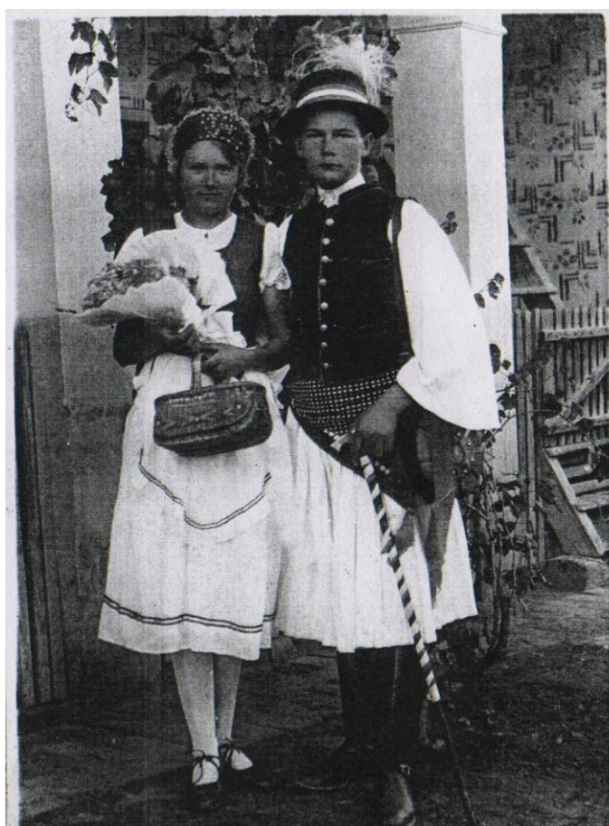
17. kép A 48-as Kör szüreti felvonulásának egyik csőszpárja az 1940-es évek első felében