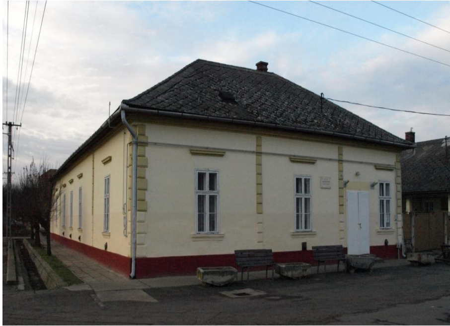
1. kép A 48-as Kör épülete az Iskola köz – Árpád utca sarkon.