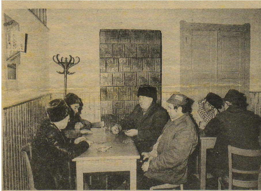
12. kép Kártyázó asztaltársaságok a 48-as Kör frissen felújított kistermében az 1988-89-telén.