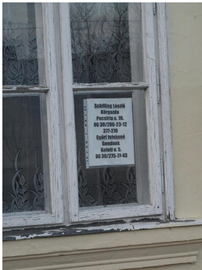
35. kép A körgazda és a gondnok elérhetősége az ablakban van kifüggesztve.