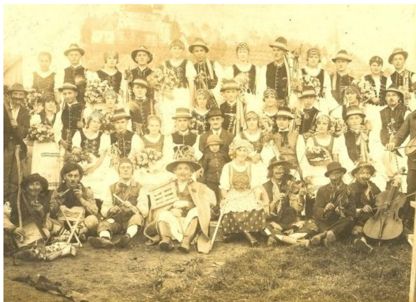
16. kép Az Ipartestület szüreti báljának szereplői 1923-ban (87. 176. 1.)