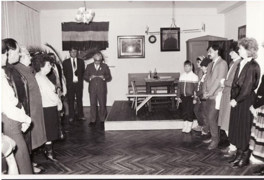
33. kép A körök történetét bemutató kiállítás megnyitója 1988. március 15-én a helyi Művelődési Házban.