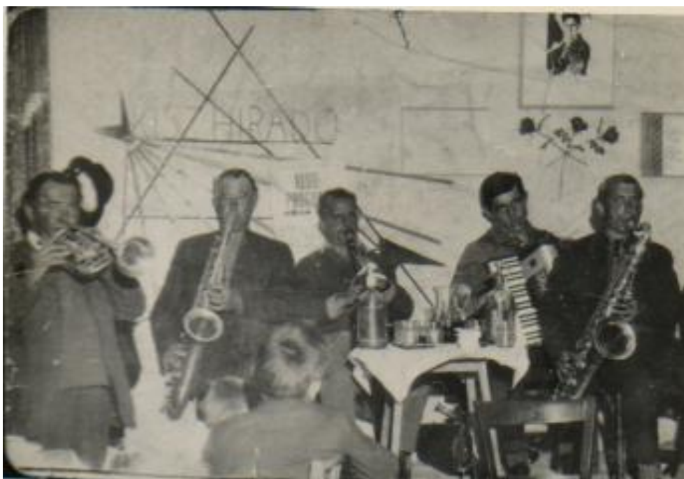
26. kép Lakodalomban fújják a zenészek a Petőfi Népkörben