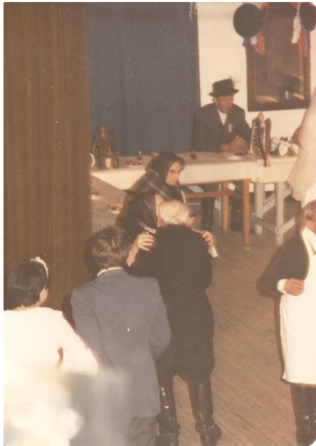
29. kép A Németfalusi Lakodalmas „színpadképe.”