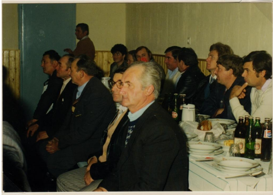
34. kép Bankett a 48-as Kör megnyitása alkalmából.