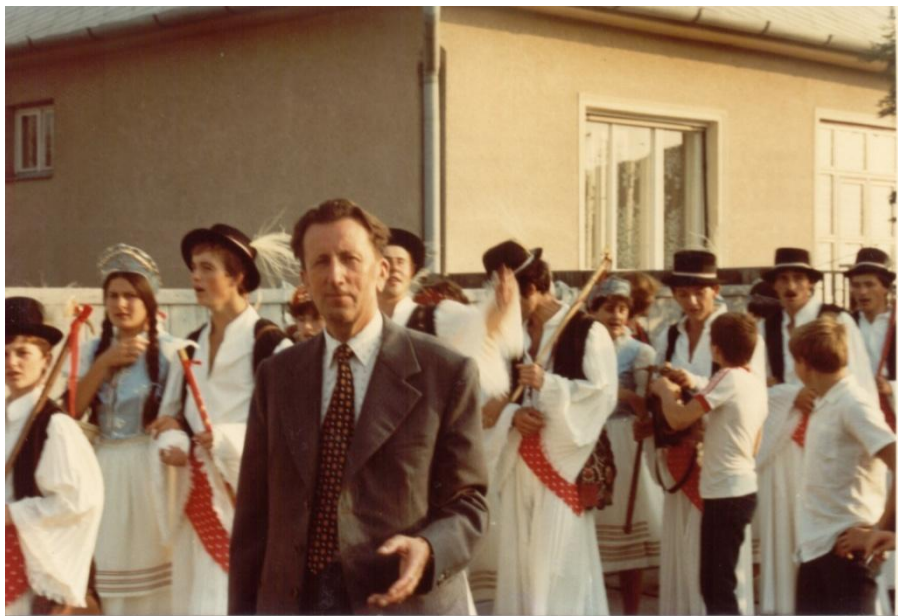
31. kép A csószpárok és a szervező 1982-ben.