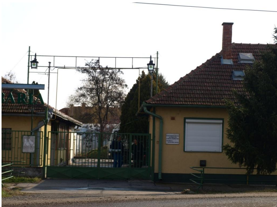
2. kép A Földmívelő Egylet székházát a Herbária vásárolta meg, a mai napig gyógynövény szárító üzem működik a helyén.