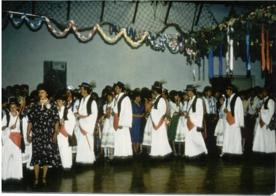
32. kép Csószpárok nyitótánca a szüreti bálban, még az iskola tornatermében 1982-ben.