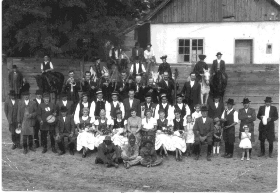
3. kép Szüreti felvonulók a Rákóczi Olvasó Népkör székháza előtt az 1950-es években.