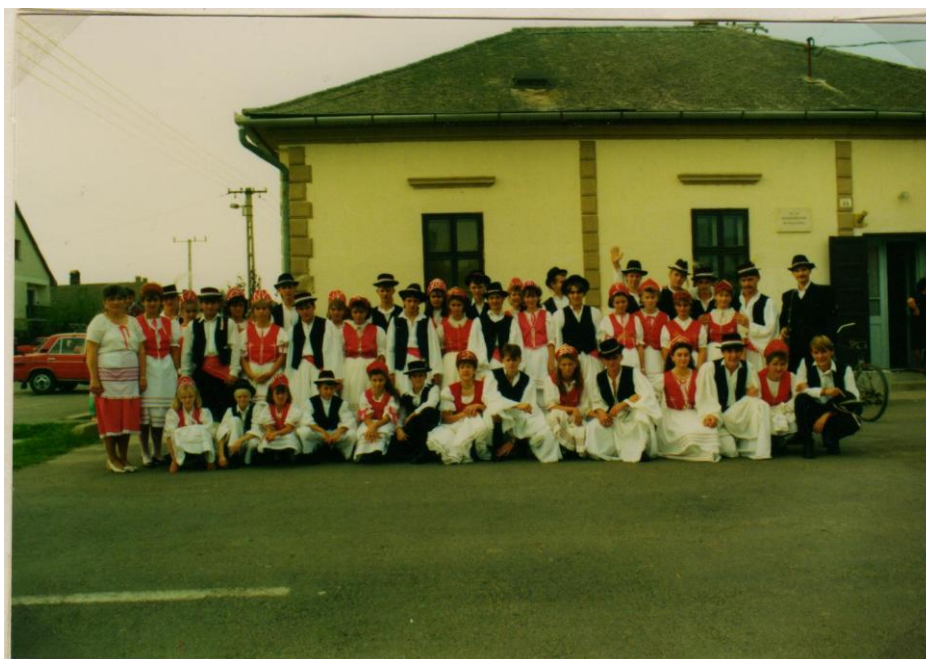
36. kép Szüreti felvonulók a 48-as Kör előtt.