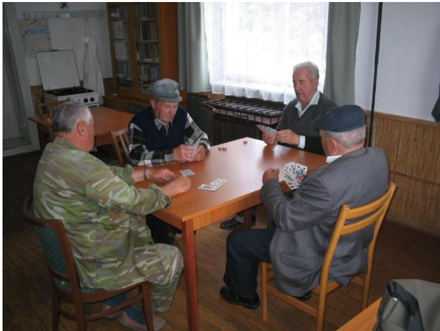
13. kép Kártyázó asztaltársaság az ezredforduló után a Rákóczi Olvasó Népkör kistermében.