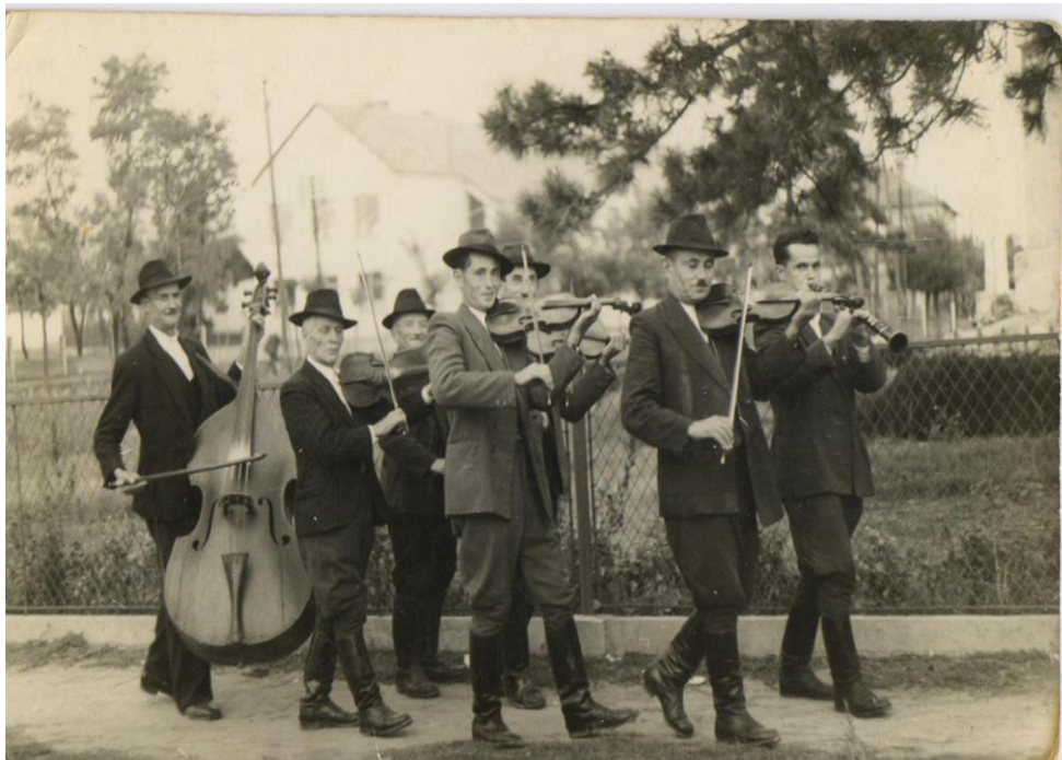
25. kép A Koroknai zenekar az 1950-es években