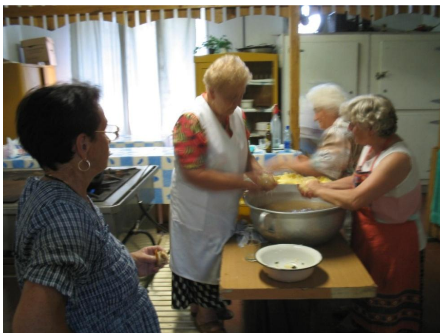
9. kép Bálra készülnek az asszonyok a Rákóczi Népkörben.