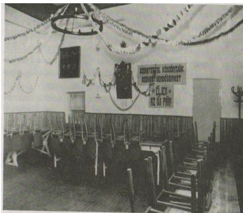
7. kép A 48-as Kör nagyterme az 1990-es évek elején, lakodalmi díszítéssel, a „főhelyen” a falitükör és az üdvözlő felirat.