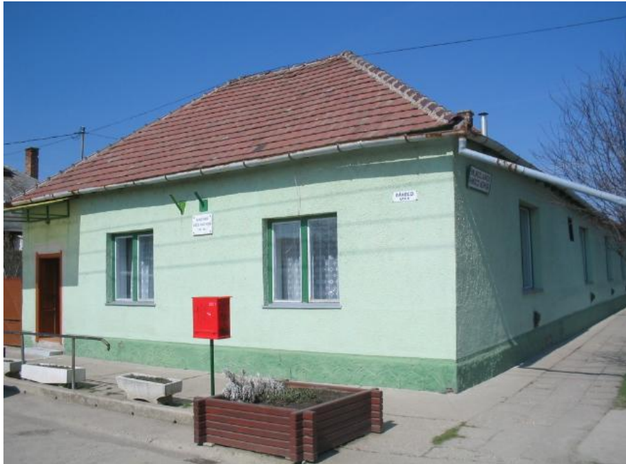
4. kép A Rákóczi Olvasó Népkör épülete az ezredforduló után a Bethlen – Rákóczi utcák sarkán.