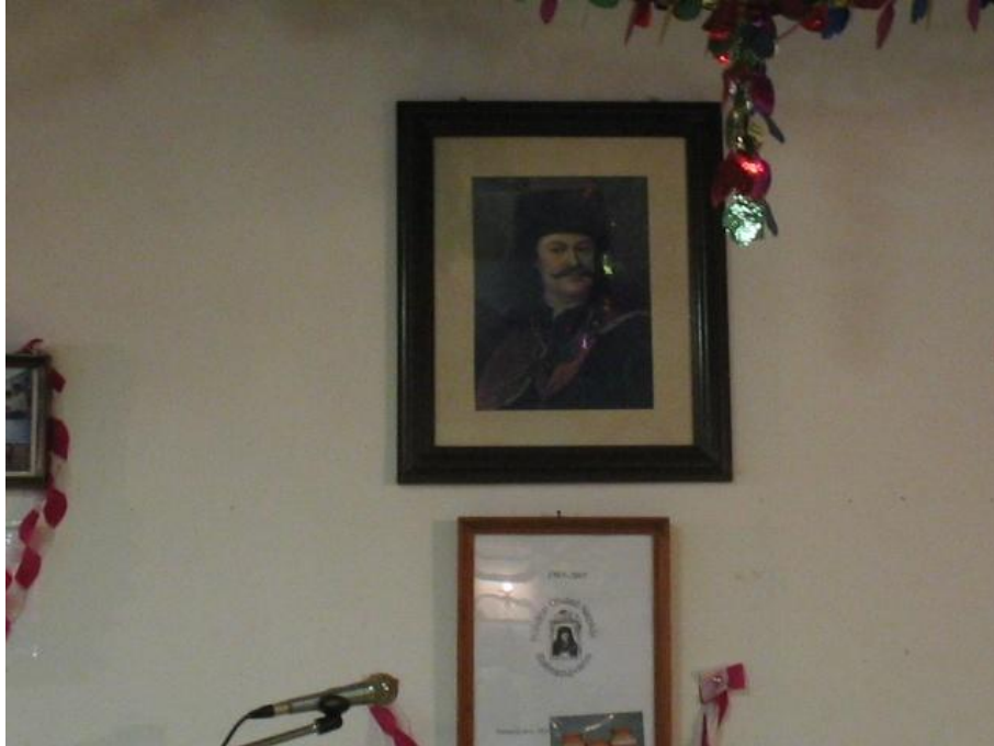
20. kép A Rákóczi – Bethlen utcák sarkán található Olvasó Népkör az 1950-es években Rákóczi Olvasó Népkör/Népfront Kör nevet kapott. A kör falát ma Rákóczi portré díszíti.