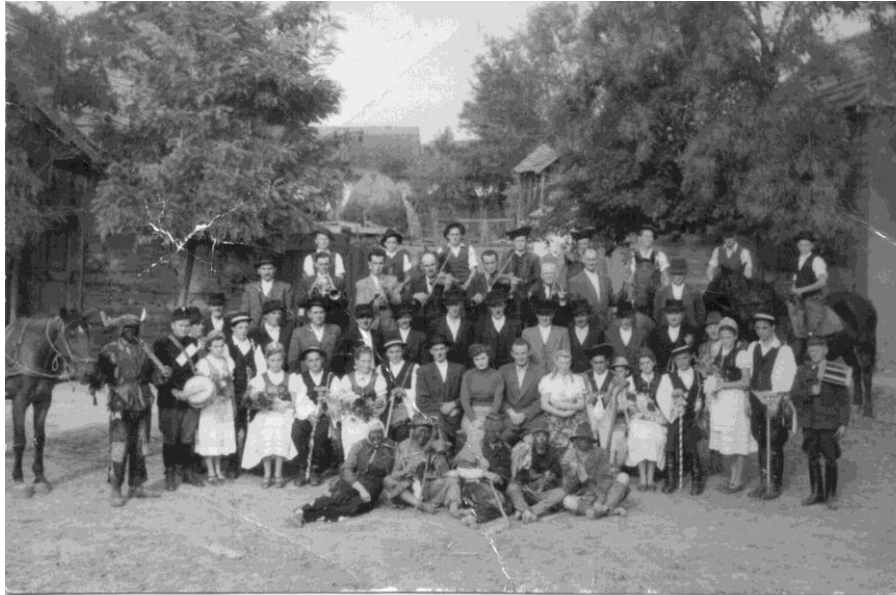
24. kép Szüreti felvonulók az 1950-es évek második felében a Rákóczi Olvasó Népkör szervezésében.