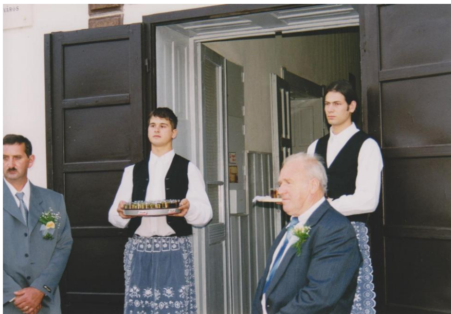
38. kép Vendégek fogadása a 48-as Körben rendezett lakodalmon.