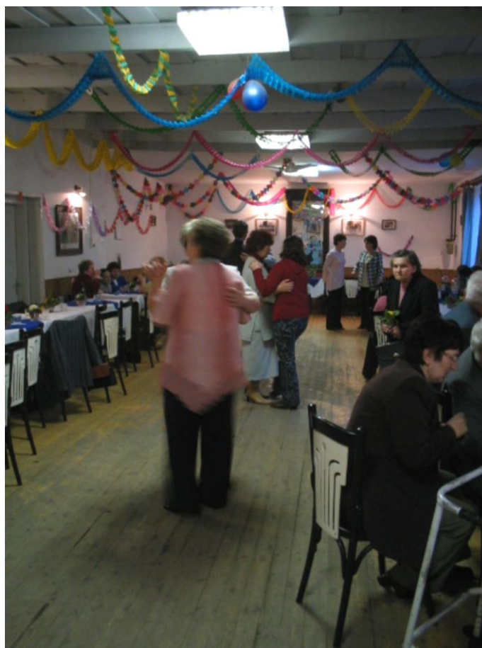
8.kép A Rákóczi Népkör feldíszített nagyterme