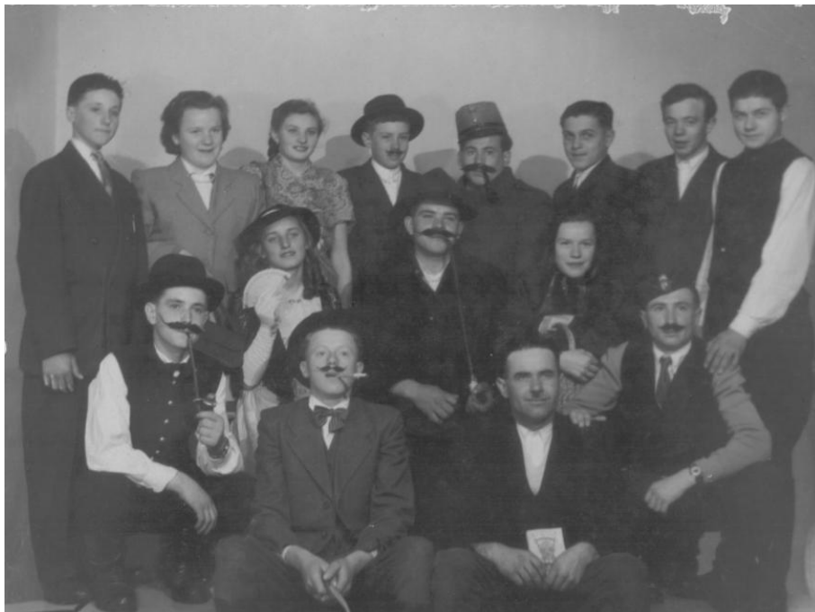
21. kép Színjátszók az 1950-es években a Kossuth Körben.