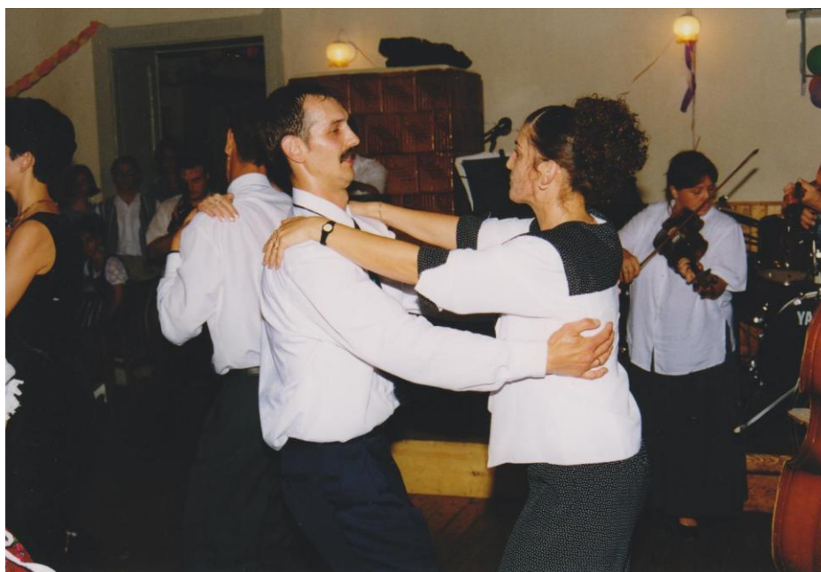
39. kép Csárdás a kör nagytermében.