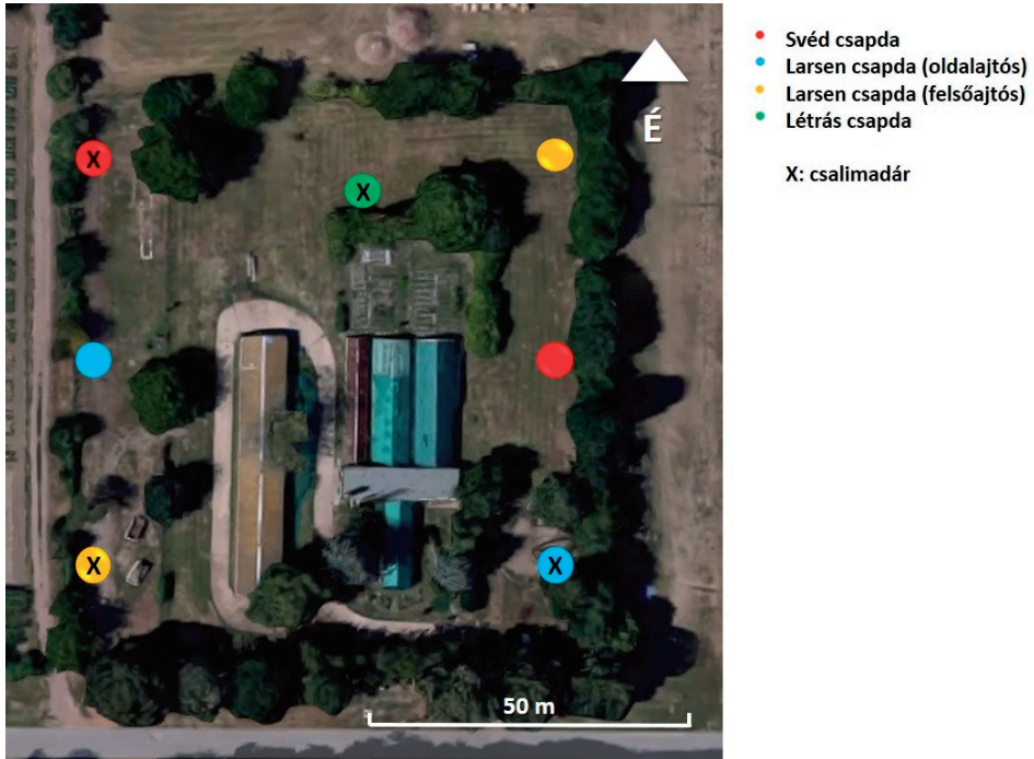
2. ábra. A csapdák elhelyezkedése a csapdázási területen

repülést, az egyedek viselkedését, nem okoznak sérülést, felhelyezésük nem okoz fájdalmat sem. Varjúfélék esetében is használták már a jelölés ezen fajtáját, például hollóknál (Stiehl 1983, Loretto et al. 2015), és rövidcsőrű varjaknál (Caffrey 2000). A biléták felhelyezése több módon történhet. Egyik lehetőség a biléta humerus köré történő rögzítése (Morgenweck & Marshall 1977). Ennek hátránya, hogy kevésbé tartós, lazán felhelyezve elfordulhat a szárny körül, túl szorosan pedig duzzanatot okozhat (Curtis et al. 1983). Egy másik, gyakrabban alkalmazott módszer a szárnybiléta patagiumon keresztül történő rögzítése (Mudge & Ferns 1978, Stiehl 1983). A biléta felhelyezésére többféle módszert alkalmaznak: használhatnak például vékony műanyag húrt (Caffrey 2000), rozsdamentes acél tűt (Mudge & Ferns 1978), fém szegecsket (Stiehl 1983), vagy különböző füljelző krotáliákat (Reading et al. 2014). A rögzítés ezen típusai sokkal tartósabb jelölést eredményeznek.