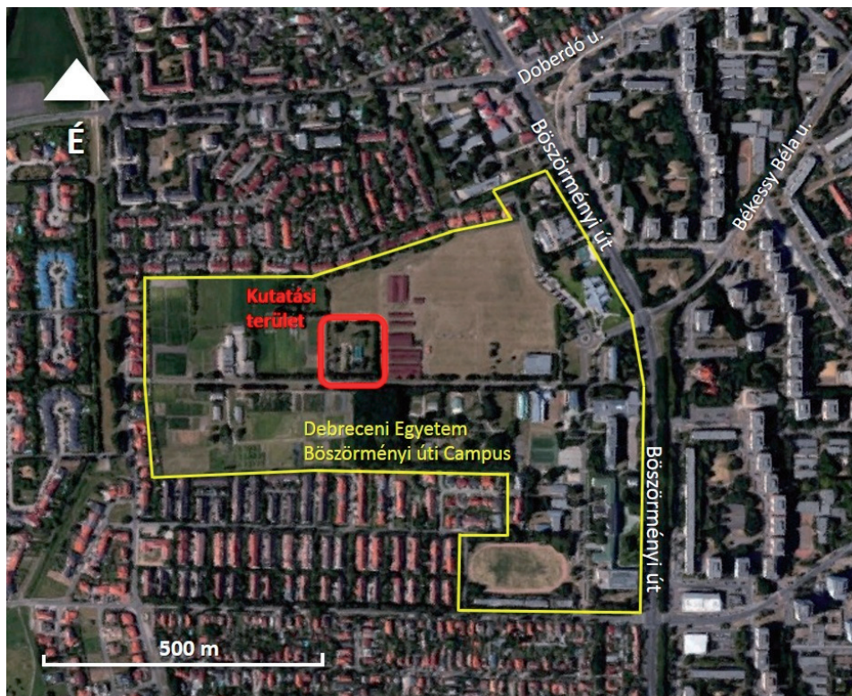
1. ábra. A csapdázás helyszíne a Debreceni Egyetem Bösörményi úti Campusa területén.