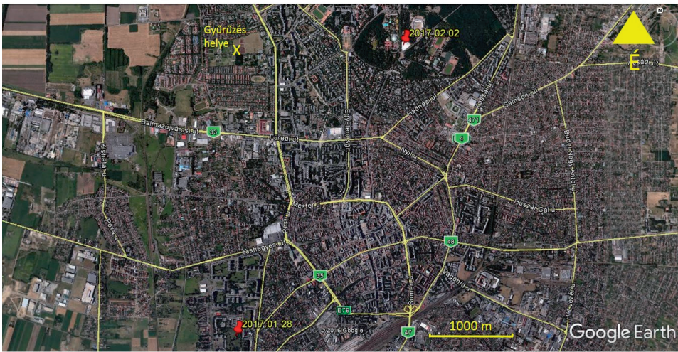
4. ábra. A 21-es egyed mozgása (n=2).

A varjak pontos mozgásának felmérésére GPS jeladós jelölés jelentene megoldást, mivel így egzakt módon követhető lenne az egyes egyedek mozgása. A városból érkező visszajelzések mellett csapdával is történtek visszafogások, erre a csapdázás időtartama alatt 9 egyed esetében mintegy 100 alkalommal került sor. Itt említést érdemel egy csapdafüggővé vált madár, amely több mint 30 alkalommal került visszafogásra, szinte kivétel nélkül a létrás csapdából. Ez a viselkedés valószínűleg az állandó táplálék jelenlétével magyarázható.