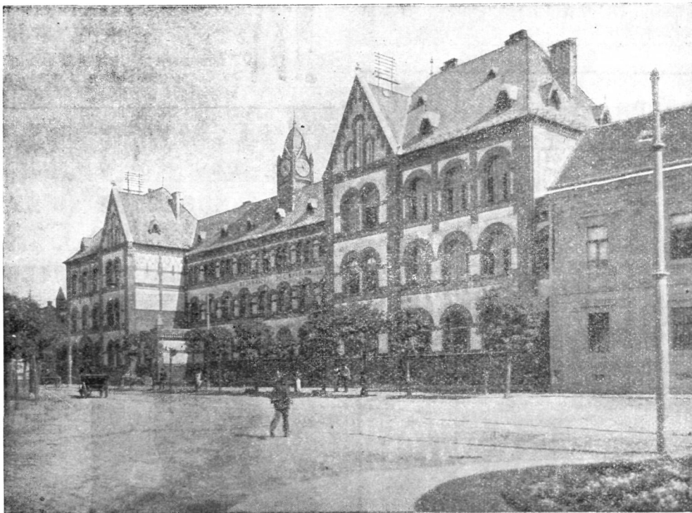
A debreczeni református új főgimnázium.

Szt. Anna-u. és Aitila-tér sarok. - Gyógyszertár a „Nádor“-hoz.