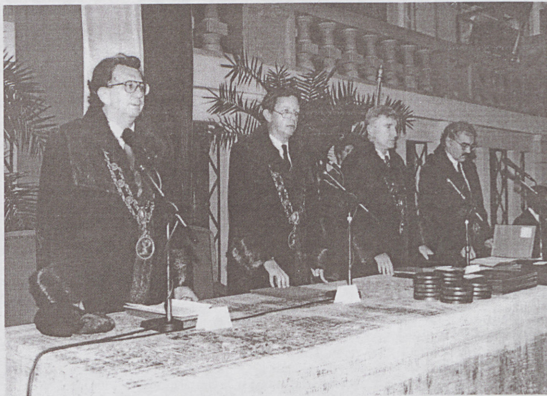
A leköszönő Rektori Vezetés

Valamennyi beruházás és rekonstrukció levezénylése sikeres volt. A Freseniussal kötött szerződés során mintegy 300 millió Ft szabadon felhasználható támogatáshoz jutott az Egyetem. Megoldódott az Elméleti Tömb külső hőszigetelése.