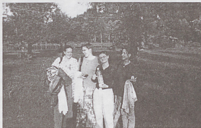
Wildonban a diákokkal

Összességében rengeteg féle műtétet láttam, s asszisztálhattam cholecystectomián, csípő endoprotézis beültetésén és cserén is, hemorrhoidectomián, inguinalis