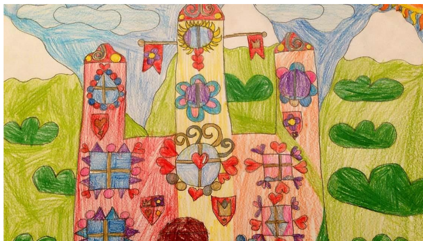
3. ábra Mesék zongorára – palota – 8 éves lány rajza

A 3. ábra alkotója a meséből kiemelve a palotát örökítette meg. A fantáziadús, részletgazdag díszítés, a középpontban megjelenő szív alátámasztja, hogy ebben az épületben nagyon változatos, érdekes események történnek, ami az alkotót kellemes érzéssel tölti el. Az élmény áttevődik a formák, a díszítés elemeire (Tihanyiné, 2013) az átfordításkor megjelenő kifejezési feszültség (Gerő, 2007) látható formába öntötte az élményt. A megjelenő esztétikumot a pozitív emocionalitás erősíti, a térben szabályosan elhelyezett rajz harmonikus, kiegyensúlyozott gyermeket feltételez.