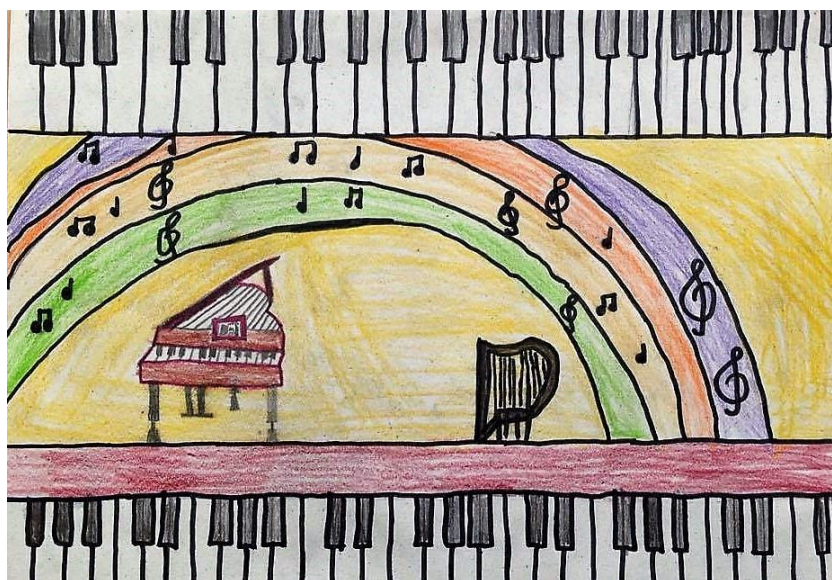
2. ábra Mesék zongorára – szivárvány – 9 éves fiú rajza

Jellemzően a rajzokat három csoportba lehetett sorolni. Az első csoport azt örökítette meg, amit látott, fontosnak találva a fellépők és a környezet megjelenítését. A második csoportba tartozó alkotók az előadás részletét vagy részleteit emelték ki. A harmadik csoportba azok a gyermekek tartoznak, akiket a látottak és hallottak megihlettek és fantáziájuk segítségével kissé elvonatkoztatva az eredeti előadástól de mégis felismerhetően ahhoz tartozót alkottak, mivel a képzeletproduktumai valóságélményre épültek. A verseny zsűrijének elnöke, László János grafikusművész három szóval jellemezte a beküldött alkotásokat, amely szerinte a lélekből jövő üzeneteket mutatják meg: “őszinteség, bátorság, színesség”.