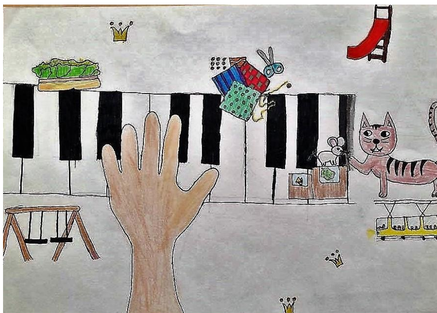
4. ábra Mesék zongorára – sűrítés – 9 éves lány rajza

A 3. ábra alkotója a meséből kiemelve a palotát örökítette meg. A fantáziadús, részletgazdag díszítés, a középpontban megjelenő szív alátámasztja, hogy ebben az épületben nagyon változatos, érdekes események történnek, ami az alkotót kellemes érzéssel tölti el. Az élmény áttevődik a formák, a díszítés elemeire (Tihanyiné, 2013) az átfordításkor megjelenő kifejezési feszültség (Gerő, 2007) látható formába öntötte az élményt. A megjelenő esztétikumot a pozitív emocionalitás erősíti, a térben szabályosan elhelyezett rajz harmonikus, kiegyensúlyozott gyermeket feltételez.