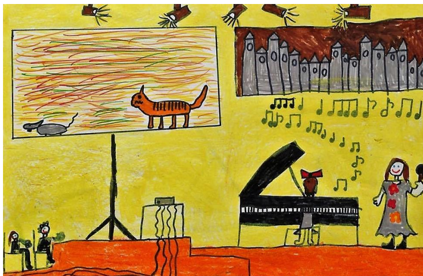
5. ábra Mesék zongorára – színpadkép

Az ifjú közönség egy része az őt körülvevő környezetet rajzolta le. Az 5. ábrán az alakok, a zongora és a projektoros kivetítő mellett az orgona síjja is hangsúlyos. Az éppen zongorázó lányt az áradó dallam jellemzi. A mikrofonnal virágos ruhában megjelenő alak, a moderátor-műsorvezető. A különböző idősíkok ábrázolását a kép a képben technika jeleníti meg. Az életkorra jellemző aprólékosságot mutatja a projektor elektromos kábeleinek ábrázolása.