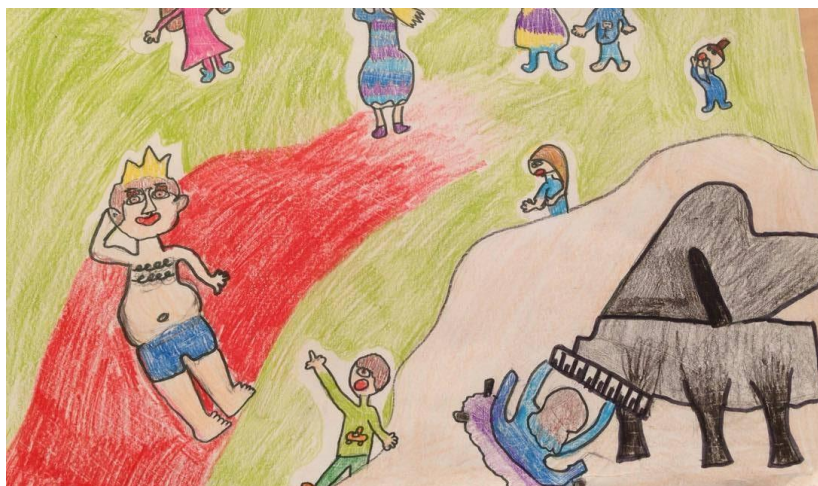
8. ábra Mesék zongorára – játszótér – 10 éves lány rajza

A 7. ábrán a színpadot keretező függöny, a teljes teret kitöltő hangjegyek egy különleges pillanat díszletei. A zongorázó lány a királyfiról álmodozik, az emocionális csomópontot az elképzelt alak középpontban való ábrázolása hangsúlyozza. A képi kifejezés kivetíti az alkotó egyéniségét, lelkiállapotát, aki valószínűleg azért választotta ennek a pillanatnak a megörökítését, mert maga is hasonló érzelmeket él át.