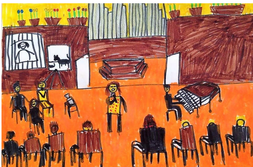
6. ábra Mesék zongorára – színpadkép és közönség

Az ifjú közönség egy része az őt körülvevő környezetet rajzolta le. Az 5. ábrán az alakok, a zongora és a projektoros kivetítő mellett az orgona síjja is hangsúlyos. Az éppen zongorázó lányt az áradó dallam jellemzi. A mikrofonnal virágos ruhában megjelenő alak, a moderátor-műsorvezető. A különböző idősíkok ábrázolását a kép a képben technika jeleníti meg. Az életkorra jellemző aprólékosságot mutatja a projektor elektromos kábeleinek ábrázolása.