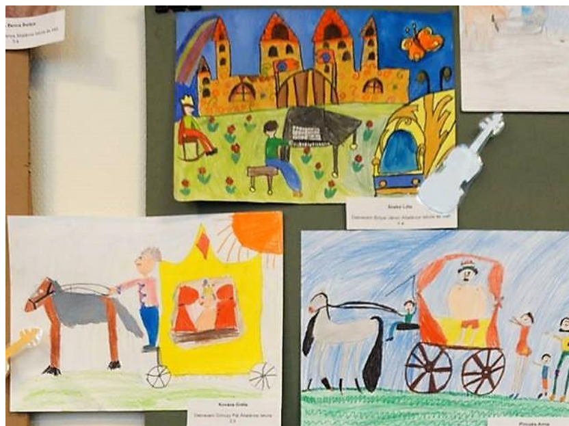
1. ábra Mesék zongorára kiállítás

Jellemzően a rajzokat három csoportba lehetett sorolni. Az első csoport azt örökítette meg, amit látott, fontosnak találva a fellépők és a környezet megjelenítését. A második csoportba tartozó alkotók az előadás részletét vagy részleteit emelték ki. A harmadik csoportba azok a gyermekek tartoznak, akiket a látottak és hallottak megihlettek és fantáziájuk segítségével kissé elvonatkoztatva az eredeti előadástól de mégis felismerhetően ahhoz tartozót alkottak, mivel a képzeletproduktumai valóságélményre épültek. A verseny zsűrijének elnöke, László János grafikusművész három szóval jellemezte a beküldött alkotásokat, amely szerinte a lélekből jövő üzeneteket mutatják meg: “őszinteség, bátorság, színesség”.