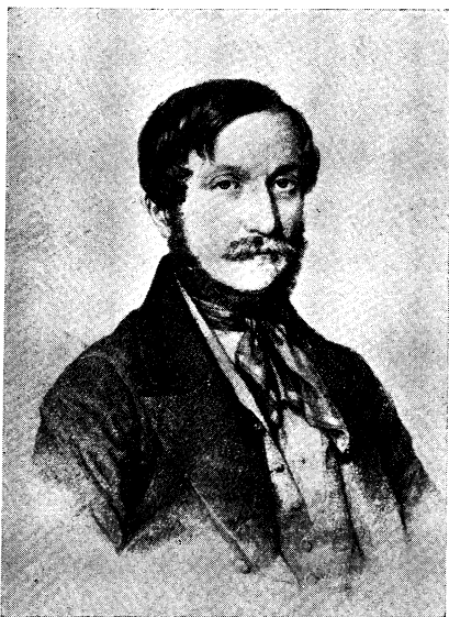
O Barão Sigismundo Kemény, autor do romance «Vida e Sonho».

O barão Sigismundo Kemény, oriundo de uma família principesca da Transilvânia (1815-1875), deu boas provas dos seus estudos no Colégio de Nagyenyed, foi funcionário no gubernium de Kolozsvár, revelou-se como romancista e publicista em Budapest, e, após a guerra da Independência, foi um dos obreiros do Convénio. Um labor incessante, sòmente entre-cortado por longas viagens ao estrangeiro, acabou