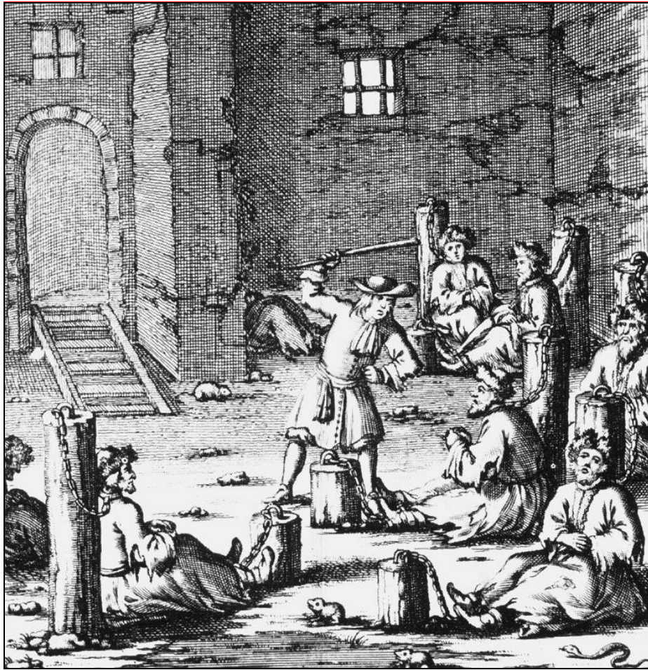
Protestantse predikanten in de gevangenis (Uit het boek van Abraham van Poot)

uitoefenen.) Tijdens die landdag werd de protestantse godsdienstvrijheid beperkt, hoewel de lutheranen en de calvinisten in het oosten van Opper-Hongarije en in het Turkse gedeelte van Hongarije in de meerderheid waren. De Hongaarse adel kon ook daarna niet met de koning in discussie treden over godsdienstkwesties. De geloofstolerantie werd pas later als een onderdeel van de politiek van Jozef II in praktijk gebracht.