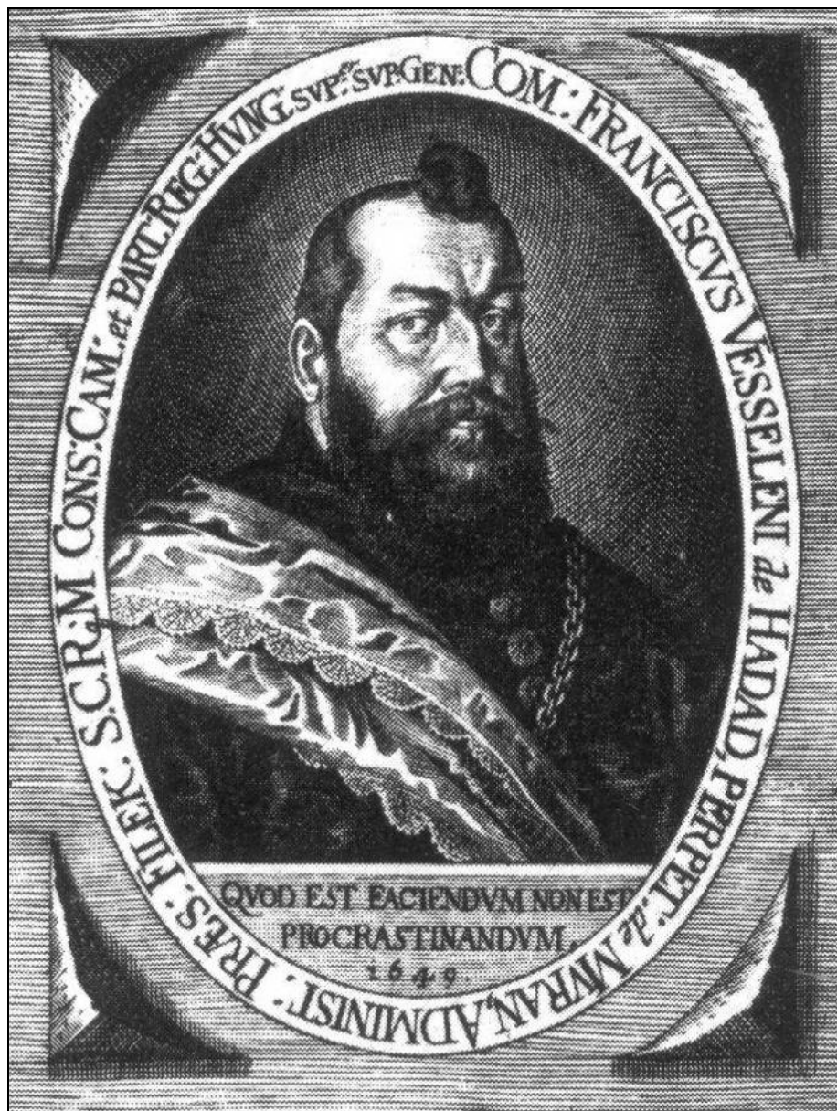
Palatinus Ferenc Wesselényi