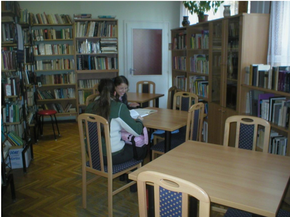
7. helyben olvasók, és az új asztalok, székek