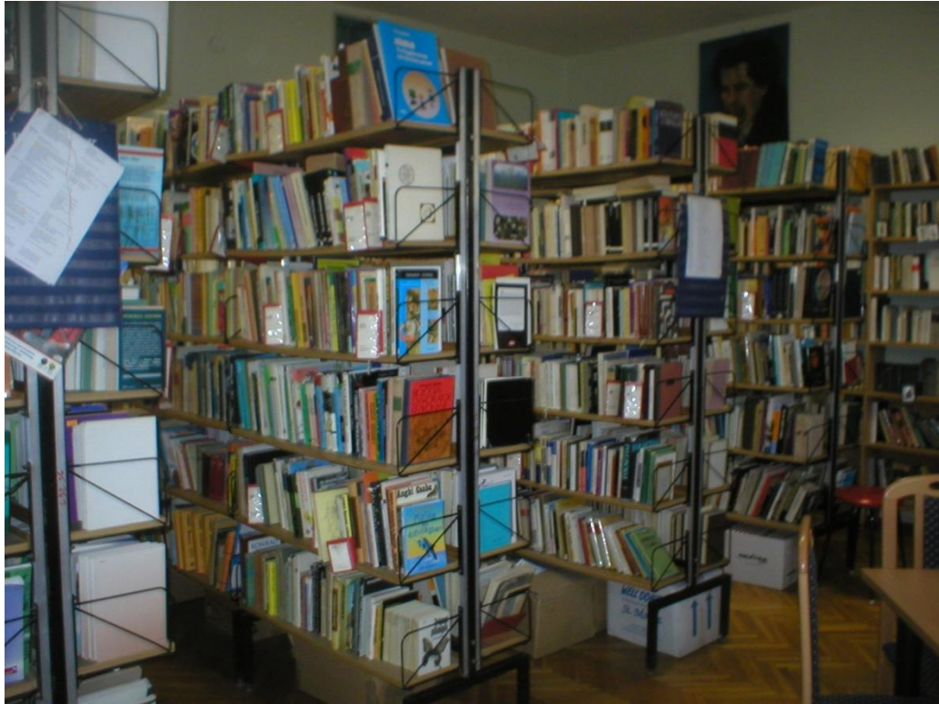
8. szabadpolcos rész, a sorok elején kifüggesztett információk