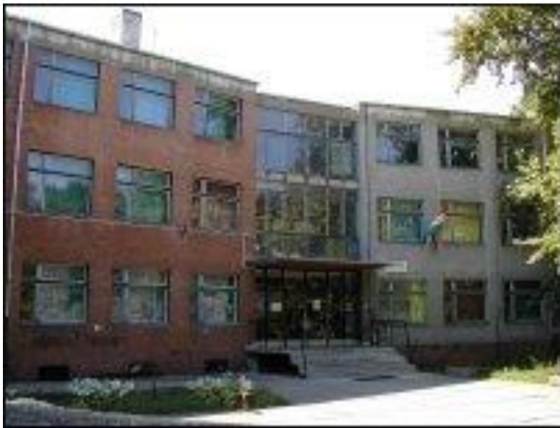
1. a Dienes régen