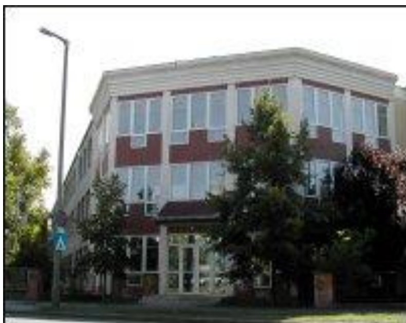
2. a Dienes ma