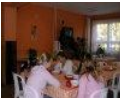
5. az ebédlő