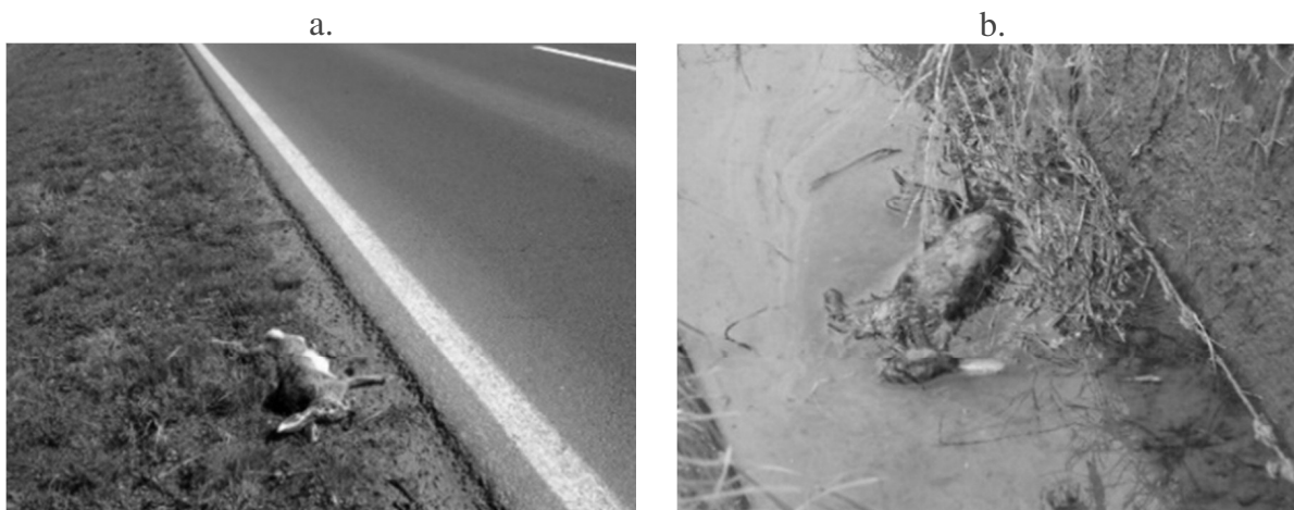
3. kép: Az ember okozta mezei nyúl elhullások (a – vadgázolás, b – mesterséges öntözőcsatornába fulladt példány)

A pillangósok a második, harmadik fialás gyakori helyszínei, ezért a kaszálások különösen veszélyeztetik a fiatal mezei nyulakat (Farkas 1977). A vadriasztás a mezei nyúl esetében a szaporulathoz nem jöhet szóba, de ha a kaszálás a tábla közepétől spirálvonalban kifelé halad a nagyobb nyúlfiókák megmaradhatnak. A mezőgazdaság vadvilágra gyakorolt indirekt hatása közé tartozik a kemikáliák felhasználása. Nikodémusz (1978) id. Biró et al. (2013) megemlíti, hogy a helyesen alkalmazott redentin nem ártalmas a mezei nyúlra. Edwards et al. (2000) vizsgálataiban a korábban paraquat hatóanyagú gyomirtó-szereknek tulajdonított nyulpusztulás okát sem Franciaországban, sem az Egyesült Királyságban nem sikerült igazolni.