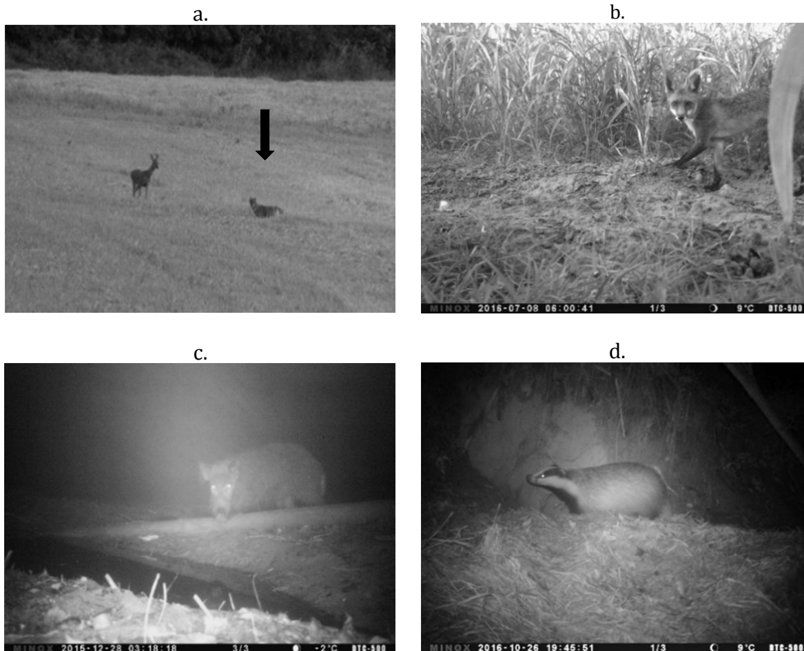
2. kép: A mezei nyúl néhány emlős predátora (a – arany sakál, b – vörös róka, c – vaddisznó, d – eurázsiai borz)