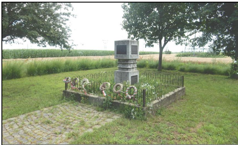
Abb. Nr. 2: Opferdenkmal auf dem Platz des ehemaligen Zwangsarbeitslagers in Tiszalök.

Als weitere Darstellungen sind die Veröffentlichungen von Frigyes Tasnádi, Josef Ringhoffer und Hans Feinrich zu erwähnen. Mit einem hohen wissenschaftlichen Anspruch wurde die Geschichte des Zwangsarbeitslagers von Ágnes Tóth, Katalin Gajdos-Frank und Barbara Bank diskutiert. 18 Die wissenschaftliche Auseinandersetzung mit Tiszalök sorgte auch wesentlich dafür, dass die Geschichte des Zwangsarbeitslagers nicht in Vergessenheit geriet. Gleichzeitig lieferten die verschiedenen Arbeiten immer wieder neue Informationen dazu, wie an das Zwangsarbeitslager erinnert wurde.