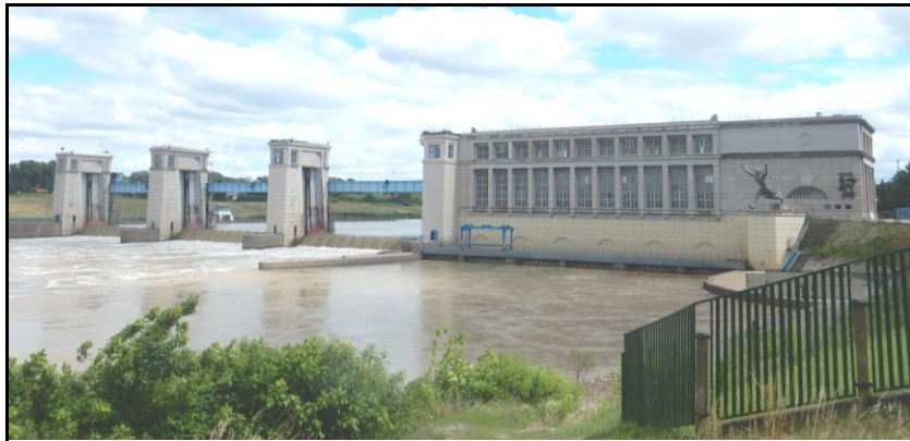
Abb. Nr. 1: Staudamm und Wasserkraftwerk in Tiszalök . Aufnahme von MM., 2020

ausgestalten, und es gab auch eine Tischlerei. 9 Diese Umstände waren in der Geschichte des Lagers von besonderer Bedeutung, weil die Gefangenen hier Bilder, Gemälde und auch andere Kunstwerke gestalten konnten. Ebenfalls erwähnenswert ist, dass es Bereiche gab, in denen die Gefangenen mit anderen BürgerInnen zusammenarbeiten mussten, die nicht Gefangene waren. Wie meine Feldforschungen beweisen, kamen Bauarbeiter jedoch nicht nur aus Tiszalök , sondern auch aus anderen Gemeinden und Städten.