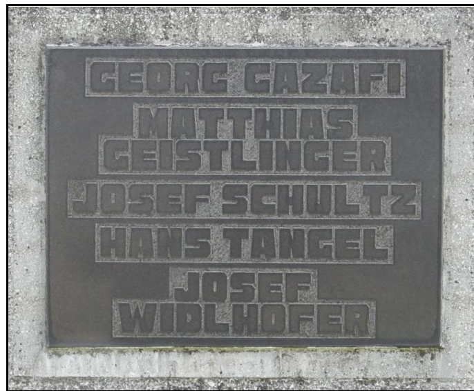
Abb. Nr. 3: Opfer des niedergeschlagenen Aufstandes vom 4. Oktober 1953 in Tiszalök – Aufnahme von MM., 2020

Die Gedenktafel enthält die Namen der fünf Todesopfer und auch eine zweisprachige Inschrift: