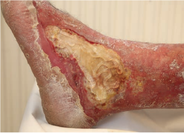
4. ábra Necrotikus seb kezelése hydrogéllel

nem áll fenn, akkor elegendő a tágult oldalágak kezelése mini phlebectomiával (20, 21) vagy scleroterápiával. Mini phlebectomia előtt tumescens anaesthesia javasolt, ami nemcsak a fájdalmat csillapítja, hanem a kezelendő véna környező szövetektől történő kireparálását is segíti. Néhány milliméteres incíziós nyíláson át történik a tágult oldalág véna eltávolítása, a nyílások öltéssel zárása sem szükséges, sebselek fixálása speciális ragasztócsíkkal elegendő, így a sebek szinte nyomtalanul gyógyulnak néhány nap alatt (3. ábra). A VSM, VSP oldalágak kezelése sclerotrapiával is történhet 1-2%-os polidocanol alkalmazásával. A beavatkozások után kompressziós fásli vagy harisnya viselése ajánlott.