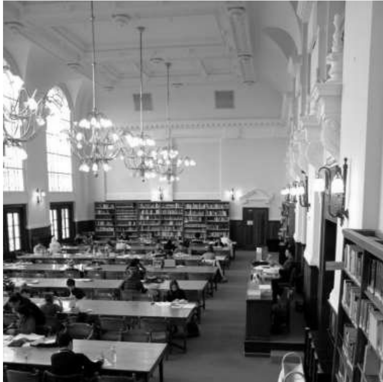
A könyvtár nagy olvasóterme az egyetem főépületében.

nemzeti könyvtári jellegét. Magyarország nemzeti gyűjtőkörű könyvtáraként azóta is részesedik a hazánkban megjelent könyvek és folyóiratok mellett a zenei nyomtatott, hangzó dokumentumok, CD-ROM-ok, aprónyomtatványok köteles példányából.