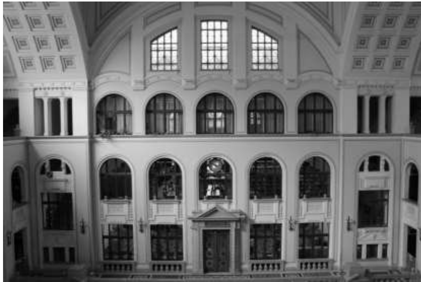
A könyvtár homlokzata az egyetemi főépület díszudvara felől.

Könyvtárunk törzsgyűjteménye a néhány éves ideiglenesre tervezett Simonffy utcai bérletéből csupán 15 év után talált méltó otthonra, az egyetem főépületének külön könyvtári célra tervezett igen impozáns részében, Debreceni Magyar Királyi Tisza István Egyetemi Könyvtár néven. A tágas és korszerű, 2 millió kötet és több száz olvasó befogadására tervezett épületrészbe már 100 000 kötetes állomány költözött át 1932–33 telén. Nagyobb mérvű gyarapodás 1935 után következett; a második világháború utolsó évében négyszeresére nőtt a könyvtár könyv- és folyóirat állománya.