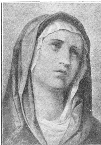
A SZÜZ ANYA, Michelangelo festménye.

Nagy választék mindenféle hangszerekben!!