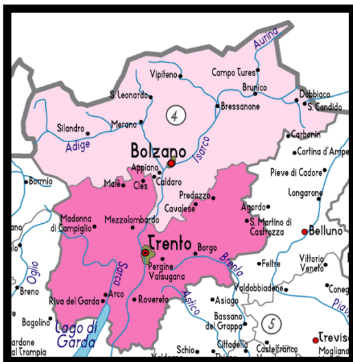
3. ábra. A Trentino-Alto Adige Autonóm Körzet térképe (a 4-es számmal jelölt világosabbra színezett terület Dél-Tirol)

A régió autonómiáját kimondó státútum értelmében az autonóm körzeten belül minden nyelvi csoport (német, olasz, ladin) tagjai jogegyenlőséget élveznek, mindegyikük etnikai és kulturális sajátosságai védelemben részesülnek. Dél-Tirol német nyelvű polgárainak joga van a bíróságokkal, a közigazgatás szerveivel és hivatalaival, valamint a közszolgáltatást ellátó koncessziós vállalatokkal való érintkezésben anyanyelvüket használni. Ami a felsőoktatást illeti, a státútum lehetővé teszi, hogy a dél-tiroliak számára Ausztria töltsen be a kulturális haza szerepét. Ennek egyik jele az egyetemi és főiskolai diplomák, illetve címek, tudományos fokozatok kölcsönös elismerése Ausztria és Olaszország között.