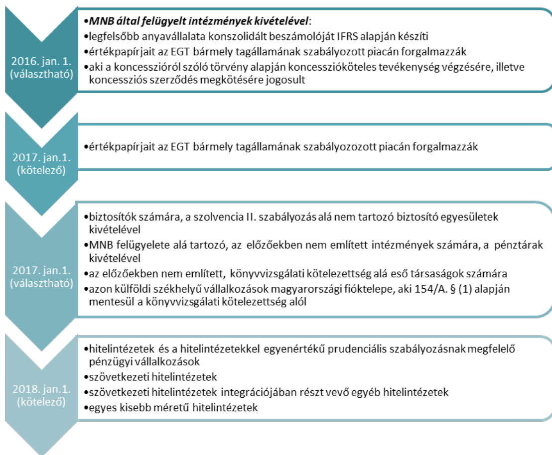
1. ábra. Az IFRS-ek hazai bevezetéséhez kapcsolódó határidők és érintettek köre

november 29-én fogadta el az Országgyűlés a „2015. évi CLXXVIII. törvényt a nemzetközi pénzügyi beszámolási standardok egyedi beszámolási célokra történő hazai alkalmazásának bevezetéséhez kapcsolódó, valamint egyes pénzügyi tárgyú törvények módosításáról” [2]. A dokumentumban a kapcsolódó jogszabályok – elsősorban a 2000. évi C. törvény - módosításait rögzítették. A számviteli törvény három lépcsőben szabályozta az IFRS-ek hazai bevezetését az egyedi beszámolók vonatkozásában (1. ábra).