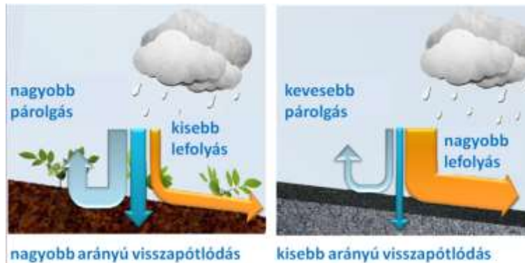
2. ábra. A megnövekedett burkolt felület hatása a lefolyó és beszivárgó csapadékvíz mennyiségére

gyobb vízmennyiség folyik le a felszínről, ami a csatornák túlfolyását gyakoribbá teszi (2. ábra).