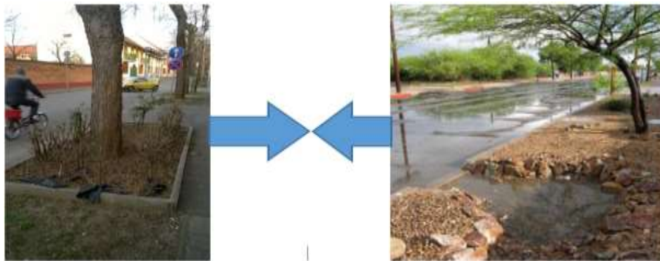
7. ábra. Bal oldalon: Egy debreceni utcában egy növényekkel betelepített zöldfelületet vízzáróan elkerítettek, a mulcs alá vízzáró fóliát terítettek. Jobb oldalon: Bevágásokat létesítettek a padkán, hogy ezeken át befolyhasson a víz a növényekkel betelepített sávba

Néhány tipikus esetet képek segítségével a legkézenfekvőbb bemutatni (7.-10. ábra):