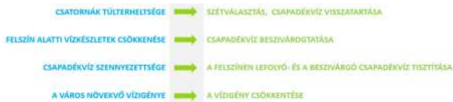
1. ábra. A városok jellemző vízgazdálkodási problémái és a zöld infrastruktúrával elérhető eredmények

Az 1. ábrán feltüntetett problémák egymással is összefüggésben állnak, emiatt olyan megoldást keresünk, amely egyszerre mindegyikre választ ad. Mivel a globális felmelegedés az egyik oka a vízgazdálkodásban jelentkező gondoknak, legalább is felerősíti azokat, a gondok megoldását jelentő ZI egyben a városoknak a klímaváltozáshoz való alkalmazkodóképességét is növeli.