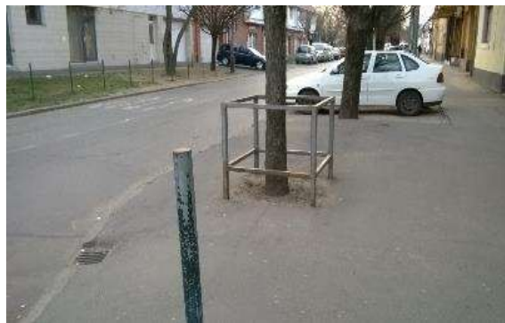
9. ábra. Egy debreceni utcarészlet: fák víz és talaj nélkül – a lefolyó csapadékvíz gyorsan elvezetésre kerül a túlterhelt csatornába