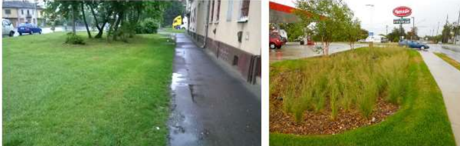
10. ábra egy debreceni utcaszélesség: Bal oldalon széles zöld sávon tud elszikkadni a csapadékvíz; javaslat: tovább javítható a megoldás, ha egy megfelelően méretezett mélységben biztosítjuk a beszivárgást, ahogy az a jobb oldali képen látható [ http://thinkwi.com/wp-content/uploads/2012/08/DSCN4268.jpg ]