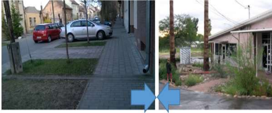
8. ábra. Bal oldalon: Egy debreceni utcában a tetőről lefolyó csapadékvíz útját leválasztottuk a csatornáról, ami kedvező, ugyanakkor a zöld sávot is gondosan elválasztották a víztől, amely a burkolt útfelület felé folytatja útját, esetleg mégis eljut a csatornába. Jobb oldalon: Csapadékvízzel öntözött kert, a lejtők alján szegélykövekkel a kimosódás megakadályozására [Mac Adam, J. 2010.]