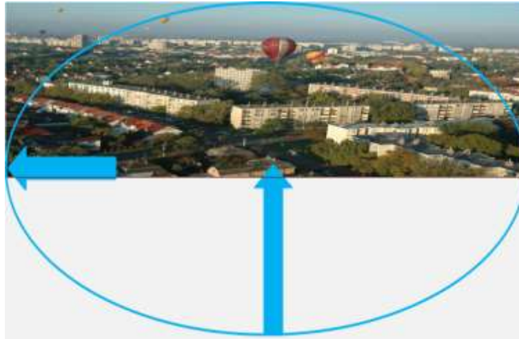
5. ábra. A felszín alatti vizet a felszínen vezetjük el, növelve a hiányt. (saját ábra)

A gondot a vízbázis védelem szempontjából is fontos orvosolni: a működő és távlati vízbázisaink védelme stratégiai kérdés az eddigi ráfordítások és a megbízható ivóvízellátás biztosításának igénye miatt. A vízkészletekben létrejött egyensúlyhiány a felszín alatti vízáramlás irányának megváltozását eredményezheti, megkérdőjelezve ezzel a kiszámítható vízminőség és vízmennyiség biztosíthatóságát.