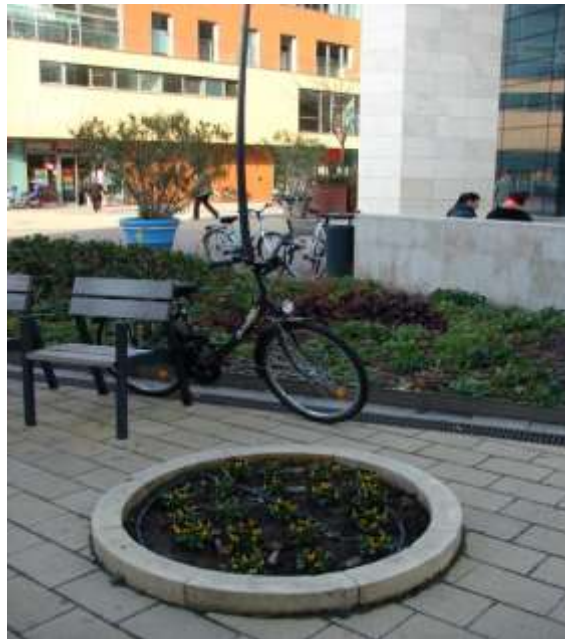
6. ábra. Jól látszik, hogy ivóvizet vezetünk a növényekhez, ehelyett odavezethetnénk a sétálóutcáról lefolyó vizet.

Ez világszerte általános probléma, de Debrecenre nem jellemző. Ugyanakkor és ettől függetlenül tovább csökkenthető lenne a város vízigénye a zöldfelületek öntözésére elhasznált mennyiséggel (6. ábra).