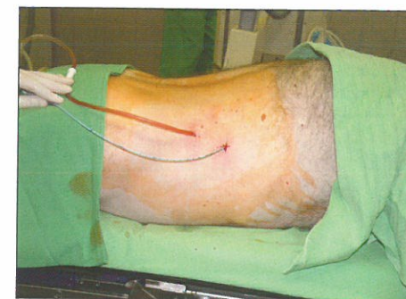
4. ábra: PCUL után a caudalis vese üregrendszer uréterének sínezése antegrád levezetett UK-val

proximálisabban nyitottuk meg. Ezekben az esetekben a trokáron keresztül 9,5 Ch-es szemiflexibilis ureteroszkópot vezetünk a disztális uréterszakaszba a kőig. Egyik esetben sikerült a követ fragmentálni és fogóval eltávolítani, míg a másik esetben nem (ez volt az első esetünk, melyet konvertáltunk).