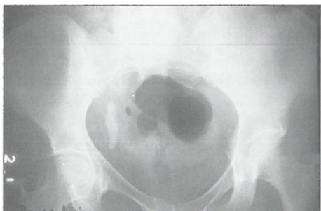
1. ábra: Jobb oldali kismedencei uréterkő, amelynél sikertelen ESWL-kezelést követően nyílt műtétet végeztünk