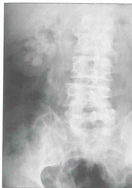
3. ábra: A jobb oldali caudalis vese-üregrendszer uréterébe ékelődött kő