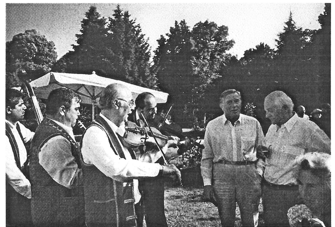
2. kép Az együttműködés vidám pillanatai