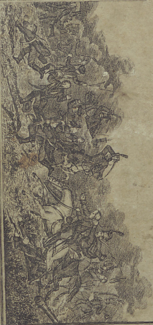
Graf Franz Adasdy's Sieg über die Preussen im Jahre 1757.