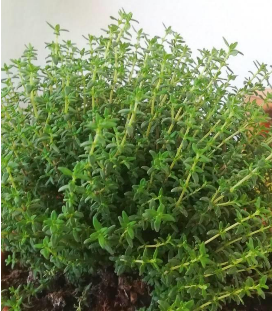
1. kép: Kakukkfű ( Thymus vulgaris )

Az oregánó tartalmú növényi kivonatok olyan esetben, mikor a süldők számukra optimális körülmények között termeltek, nem gyakoroltak jelentős hatást a sertések hízekonyságot jellemző értékmérő tulajdonságaira és a vágási paraméterekre (Janz és mtsai, 2008; Simitzis és mtsai, 2010, Ranucci és mtsai, 2015). Ezzel szemben a malacnevelés során több közlemény szerint az illóolaj-készítmények hatására nőtt a takarmányfelvétel (Li és mtsai, 2012), a testsúlygyarapodás (Li és mtsai, 2012; Xu és mtsai, 2018) és a takarmányértékesítés (Li és mtsai, 2012; Diao és mtsai, 2015). A fitogének hatékonyságában a korcsoportok között tapasztalt eltérés valószínűleg arra vezethető vissza, hogy a fiatal malacok ellenálló képessége gyenge, fogékonyak a patogén baktériumok okozta fertőzésekre, az oxidatív stresszre és a gyulladást kiváltó folyamatokra (Omonijo és mtsai, 2017).