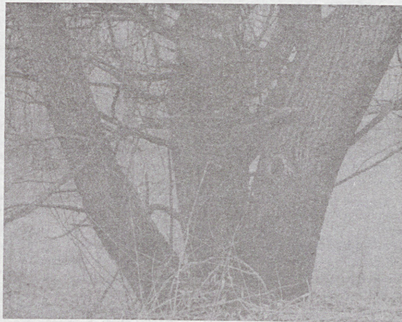
Kopárságában is festői szépségű fa a Nagyerdőn