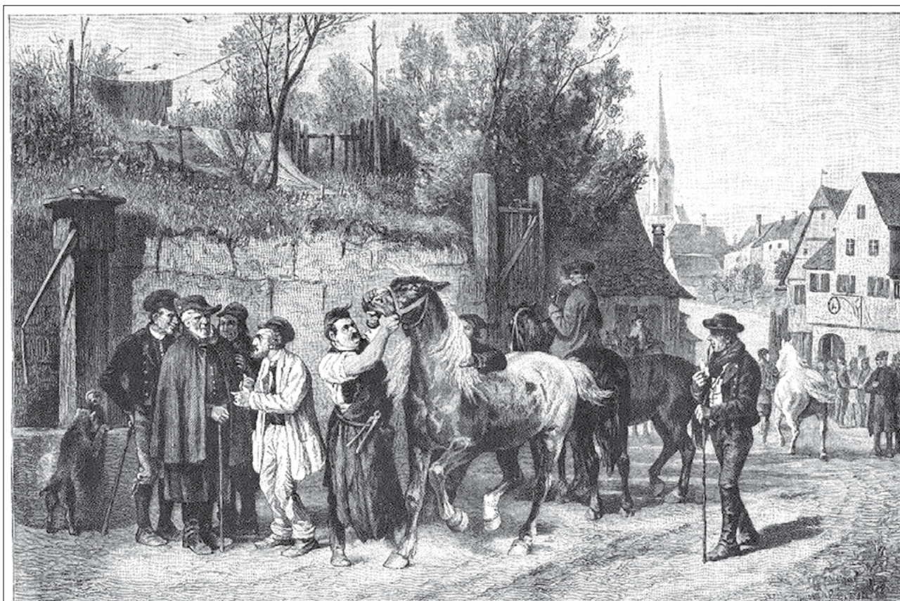
Pferdepmas in einem schwäbischen Dorfe. Nach einem Gemälde von H. Schurmann. (S. 672.)

Amennyiben az actio quanti minoris ( actio aestimatoria ) létjogosultsága mégiscsak elismerésre került az egyes