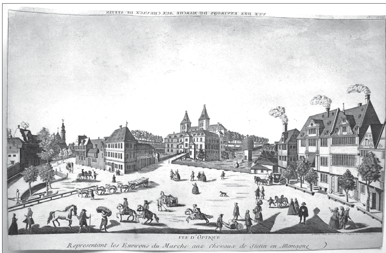
Lóvásártér a németországi Stettinben 36

A korban született jogkönyvek anyagát áttekintve az állapítható meg, hogy a XV–XVI. századi német városi és