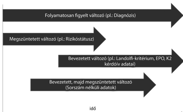
1. ábra | A Philadelphia-negatív myeloproliferatív neoplasiák online regiszterének adatmodell-karbantartása

A hagyományos rizikófaktorok mellett a kérdőív a prothromboticus fenotípus komplex feltárása érdekében az ismert thrombembóliás rizikók feltárására is fókuszált. ET-ben és PV-ben jól ismert az alacsony, intermedier és magas rizikóstatusz becslése, amely alapjául szolgálhat a betegség kezelésének, illetve a kórlefolyás becslésének. A Harrison által összegzett stratifikáció [7] azonban nem részletezi a komplex cardiovascularis rizikóstatuszra vonatkozó adatokat. Ebből kiindulva, a regiszter kialakítása során a Landolfi-kritériumok bevezetését tartottuk fontosnak (1. táblázat) [8]. A Landolfi-kritériumok a thromboticus anamnézis mellett a fehérvérsejt-, trombocytaszámra, a magas vérnyomásra, a magas lipidszintekre, a dohányzásra és a diabetesre vonatkozó adatokra is figyelmet fordít. A rizikóstatusz alapján PV-ben, ET-ben a terápia egyértelműen meghatározható (2. táblázat) [8]. A kitűzött célok elérését szolgáló regiszter kialakítása kapcsán figyelembe vettük a magyarországi munkacsoportok által tett ajánlásokat is [9, 10].