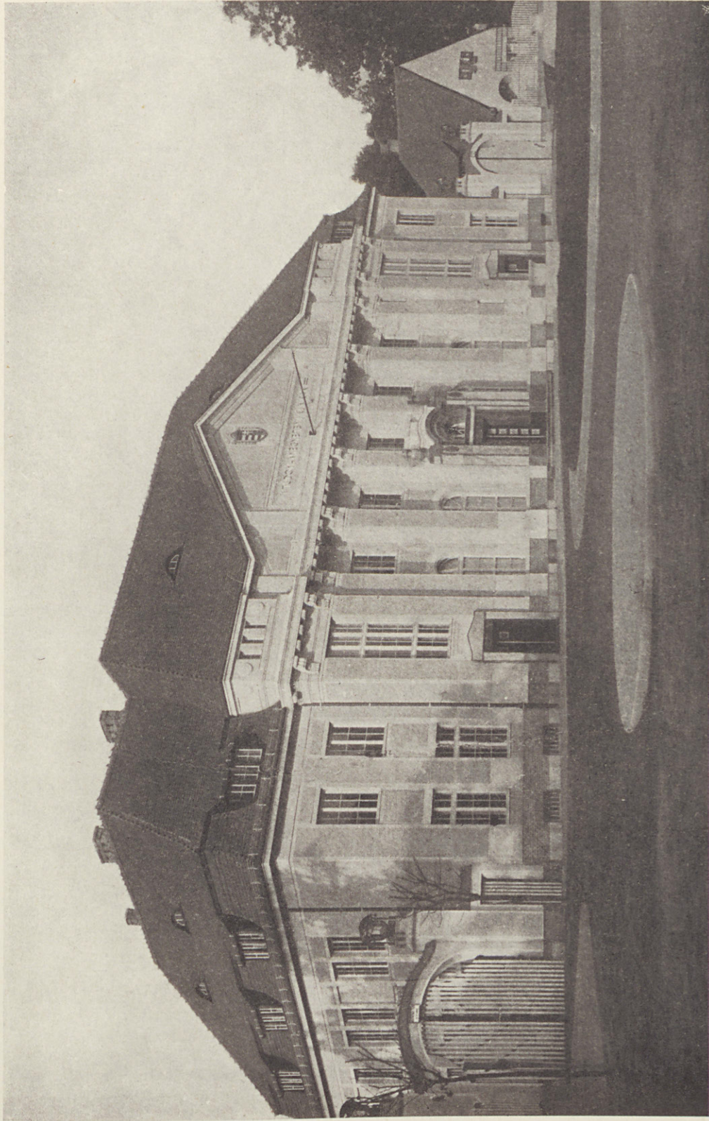
A KLINIKÁK ÉPÜLETCSOPORTJÁNAK HOMLOKTERÉBEN ÁLLÓ FELVÉTELI ÉPÜLET.