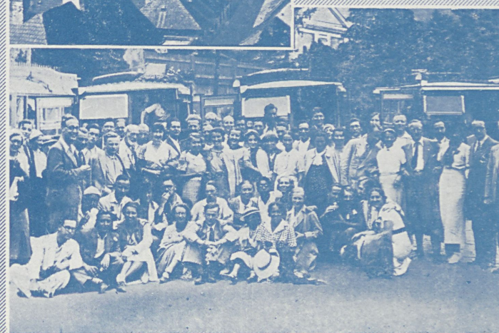
GRUPA UCZESTNIKÓW KURSÓW LETNICH NA WYCIECZCE