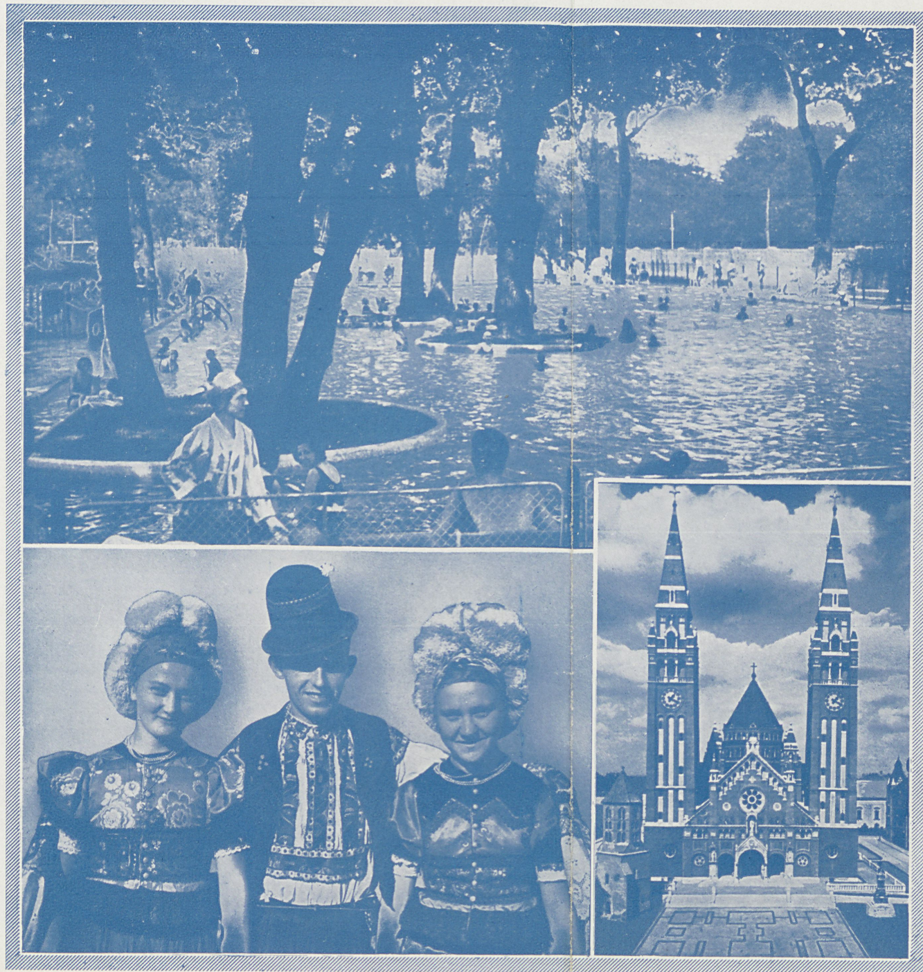
STROJE LUDOWE Z MEZŐKÖVESD