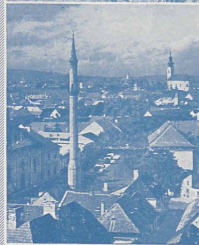
MINARET W EGER