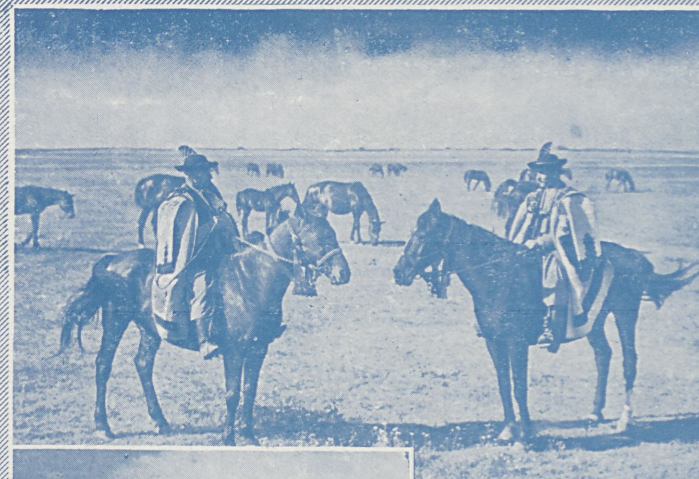
NA STEPIE WĘGIERSKIM

Szczegółowe informacje, dotyczące zapisów, warunków uczestnictwa, wykładów i kursów, dyplomów i świadectw oraz kosztów mieszkania, utrzymania i wycieczek, jak również ulg kolejowych itp., zawiera wkładka niniejszego prospektu.