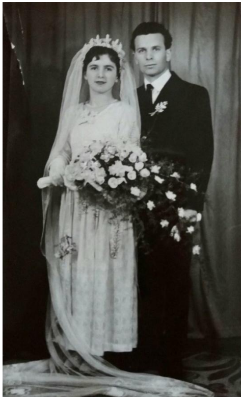
12. kép: Ifjú pár 1965-ből