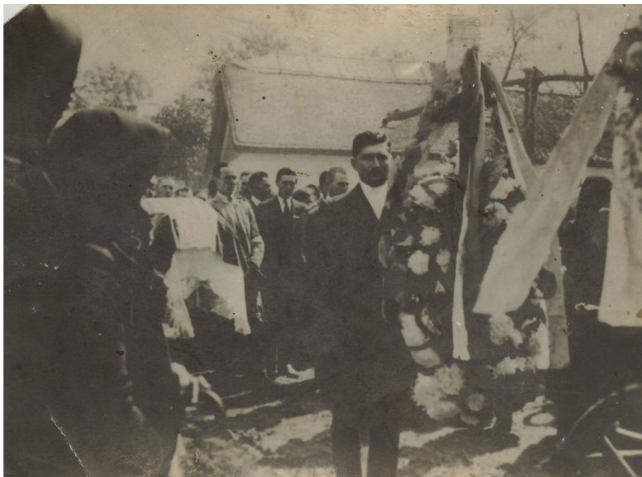
17. kép: Temetés 1940-ben

A gyászolókat mindig nyitott kapu várta. A legközelebbi hozzátartozók 1-2 órával a gyászszertartás kezdete előtt érkeztek a halottas házhoz. Az általuk hozott koszorúkat felakasztották az erre a célra előre elkészített helyekre: kerítésre, kapura, ha szükséges volt, szegeket vertek a lugasba vagy az udvarban néhány kijelölt helyre, és oda helyezték. Koszorút csak a családtagoknak illett vinni. Ezek papírból készültek, csak később jött divatba a fenyőből és az élő virágokból készült koszorú, ahogyan az a szokás is (városi hatásra 646 ), hogy ma már szinte mindenki ezzel fejezik ki végtisztességét a halott iránt.