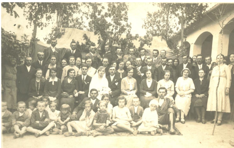
13. kép: Lakodalmi csoportkép

Elindult a násznép csendben, zeneszó nélkül a templomba. A menyasszonyt a nagyvőfély kísérte, hátuk mögött a vőlegény ment az első koszorúslánnyal, aki a menyasszony fiatalabb lánytestvére, vagy unokatestvére volt, majd a násznép kettes sorban, elöl a közeli családtagok, rokonok, majd a násznép ment. Az úton a báméskodókat mindig megkínálták a menetben haladó férfiak borral. Így haladt a násznép a templomba. Míg a templomba értek, addig a násznagyok a polgári esküvő bizonylatával a lelkészhez mentek. Ekkor fizették ki a stólát is.