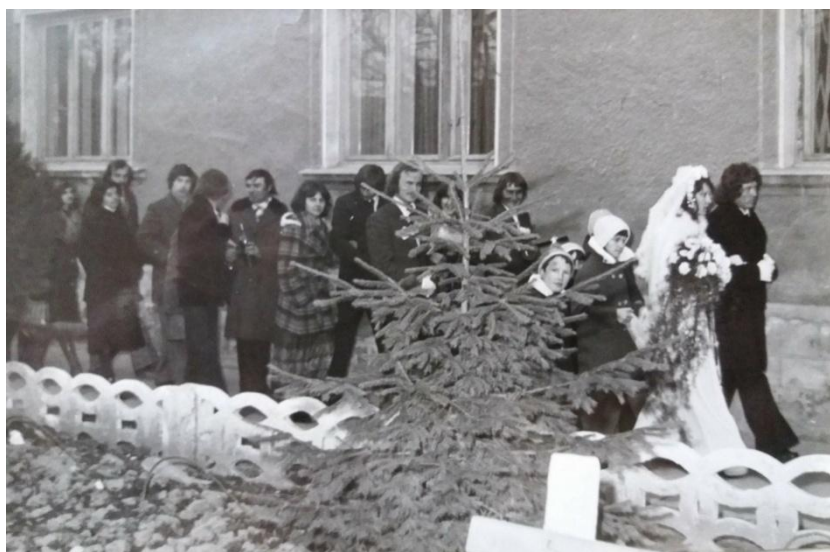
15. kép: Lakodalmi menet 1979-ben

Házasságkötés után a menyasszonyt már a vőlegény, a nagyvőfély az első koszorúslányt kísértc. A templomi szertartás után az ifjú párt zenészó fogadta. Ekkor egy sétát tett a faluban a násznép, közben a férfiak az utcán nézelődőket megkínáltak borral, miközben a zenekar kísértc a nótázó menetet.