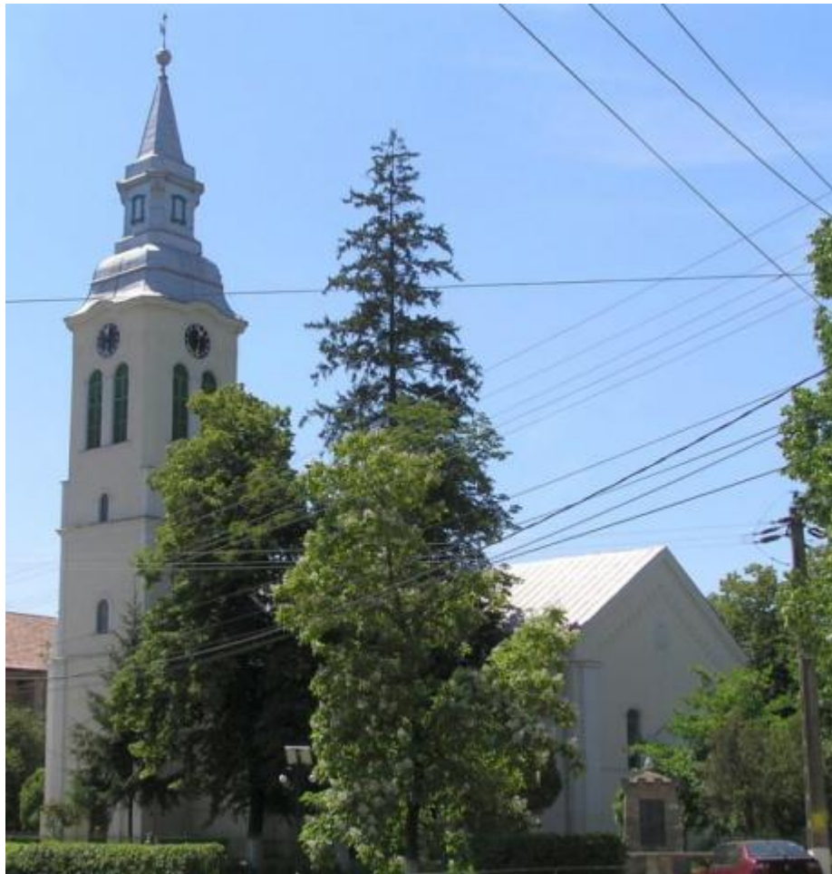
2. kép: A református templom ma

A jelenlegi tiszteletes, Bara László szolgálata alatt 2015-2016-ban bevezették a fűtést a templomba 199 és ugyanebben az évben kicserélték a templom nyílászáróit. A presbiterek és az egyháztagek sokat segítettek a munkálatokban 200 .