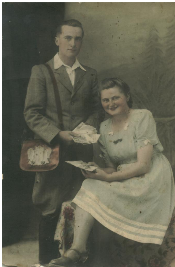
10. kép: Eljegyzés 1946-ban