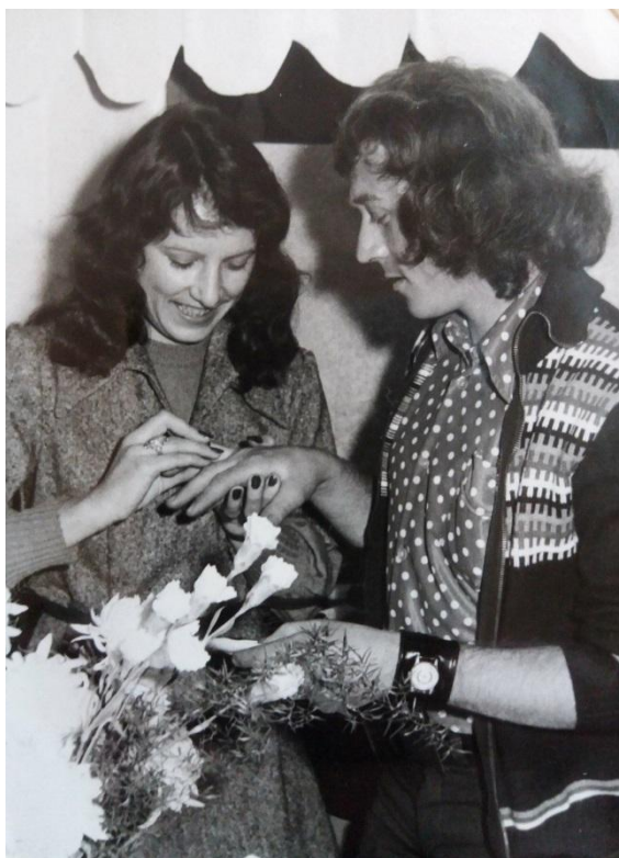
9. kép: Eljegyzés, gyűrűhúzás 1978-ban

A gyűrűk felhúzásakor az egyik családtag köszöntőt is mondott, mely szokás mára eltűnt: