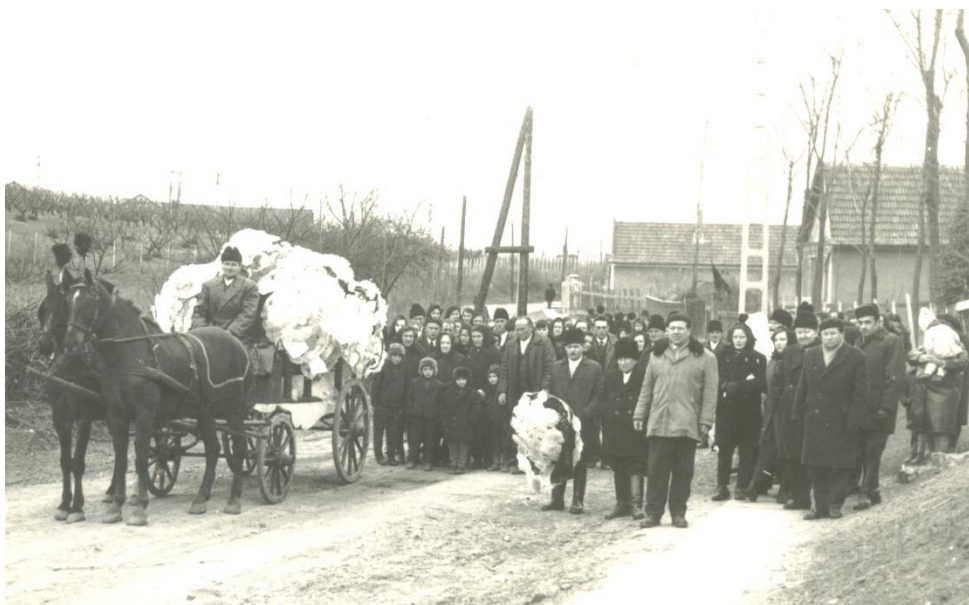
18. kép: Temetési menet 1945-ben

kaput becsukták. Egy esetre emlékeztek, amikor a halottat, (aki egy huszonéves legény volt, aki öngyilkos lett), a háztól a temetőig a barátai kézben vitték a koporsót.