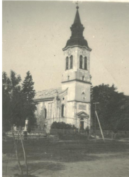
1. kép: A református templom 1940-ben

A második világháború idején, 1944 októberében a templomot két lövedék érte, mely az új templom északi falrészét részben lerombolta, valamint húsz padot megsemmisített. Ekkor semmisült meg az egyik portikusban az egyházközségi levéltár anyaga. A templomot 1945-1950 között renoválták, majd 1952-ben tették be az új padokat.