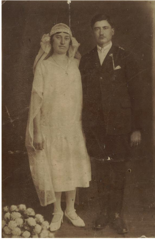
11. kép: Ifjú pár 1926-ból