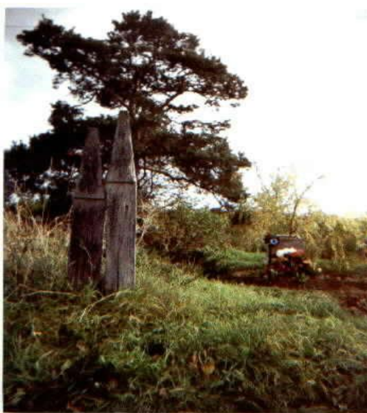
16. kép: Csónak alakú fejfa a Hegyaljai temetőben

Ezeknek az akác fejfáknak volt egy vastag része, melyet mélyen a földbe ástak, felső részük pedig keskenyebb volt.