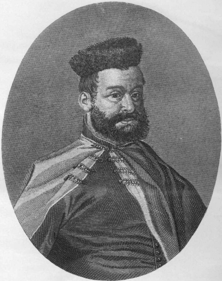
Kismarjai BOCSKAY ISTVÁN

szül. 1557-ben Kolozsvártt. Meghalt 1606 decz. 29. Kassán.