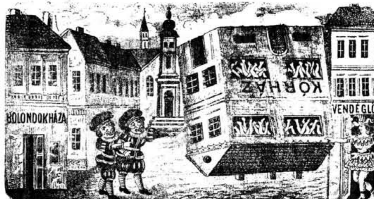
A „bohóság“ a kórházat fenekestől felfordítja.

„AZ ÖRDÖG PIRULÁI“ látványosság előadására a következő helyárak engedélyeztettek: családi páholy 8 forint, alsó és középpáholy 6 forint, másodemeleti páholy 4 forint, elsőrendű támlásszék 1 forint 50 krajczár, másodrendű támlásszék 1 forint 20 krajczár, földszinti zártszék 80 krajczár, emeleti zártszék 60 krajczár, tanuló és katonajegy örmestertől lefelé 40 krajczár, karzat 30 krajczár. A t. e. bérlő uraságok jegyci csütörtökön déli 12 óráig visszatartatnak.