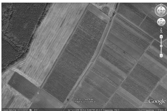
3. ábra: Nagyréde 0171/12 hrsz. számú szőlőterület