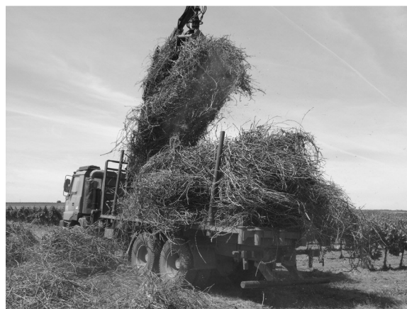
4. ábra: Venyige szállítása a mérlegelő helyre

A vizsgálat céljából a metszést követően a venyige vesszőhúzóval lett kijuttatva a sorból, majd a fajtánkénti összegyűjtésére került sor egy homlokrakodóval felszerelt traktor segítségével. Az ezt követő szállítást a mérleghelyre egy darus szállítójárművel lett megoldva (4. ábra).