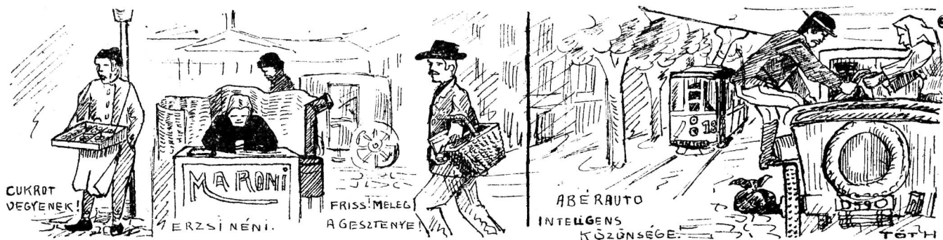
A „Debreczeni Szemle“ számára rajzolta IVÁNKA TÓTH.