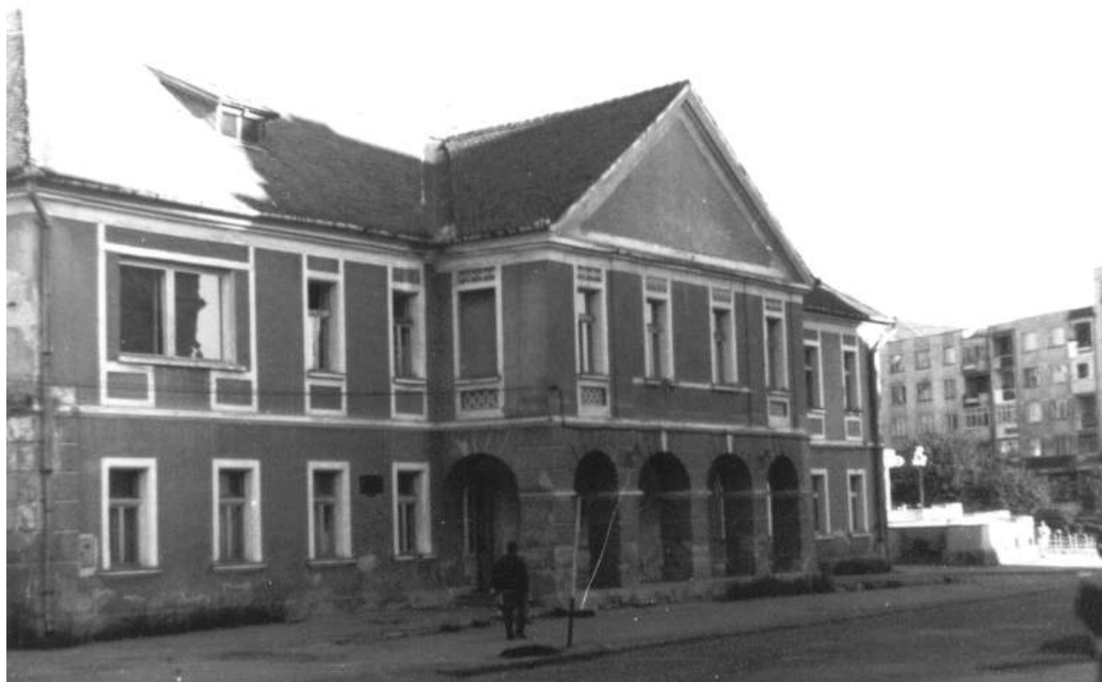
A Régi Törvényszék épülete