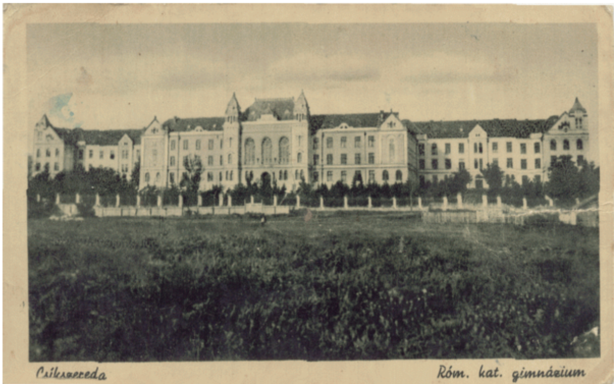
A Csíkszeredai Római Katolikus Főgimnázium építése közben és az elkészült épület