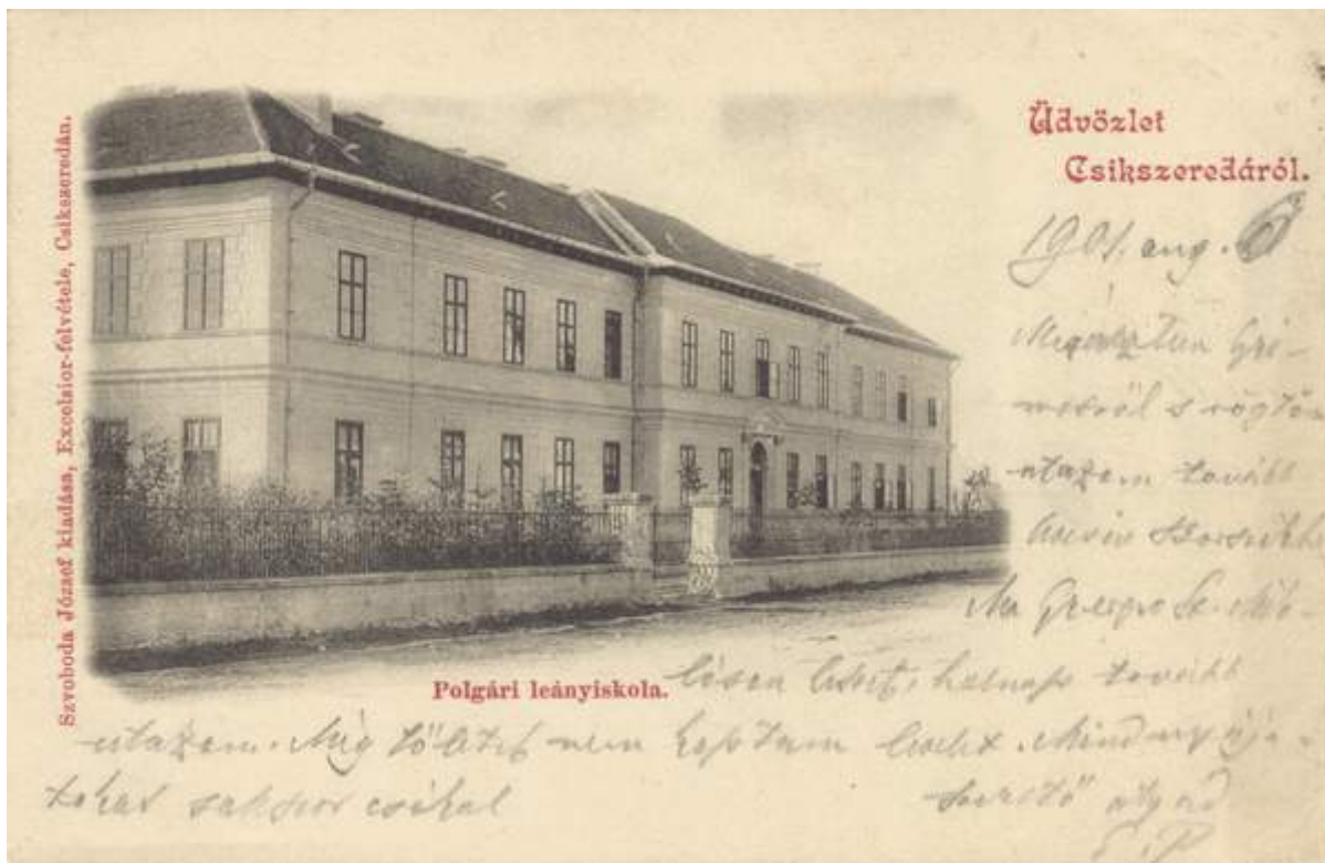
A Polgári Leányiskola