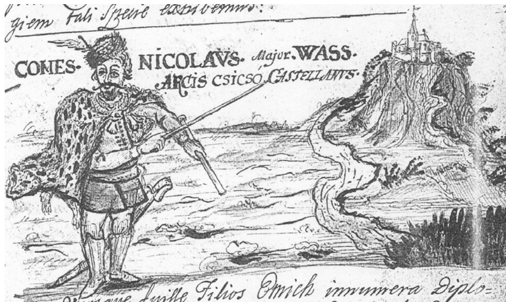
3. kép. Id. Wass Miklós (1304–1347) csicsói várnagy. 18. századi ábrázolás. (Huszti András: Genealogia heroica 17)