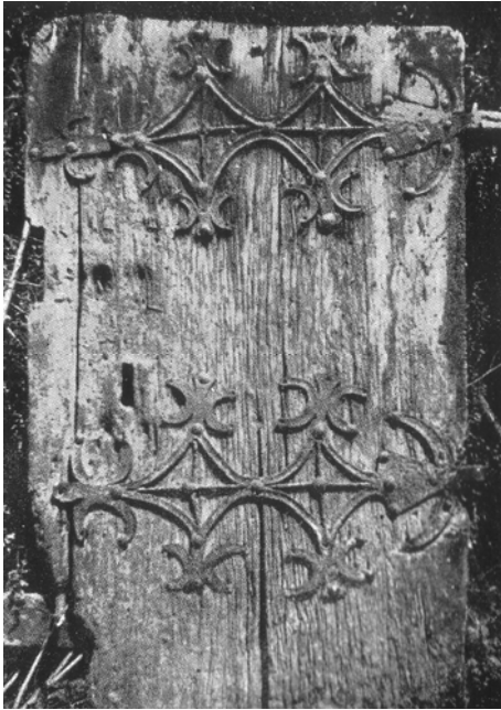
4. kép. Ajtószárny a lebontott szentegyedi templomból (14. sz. második negyede).