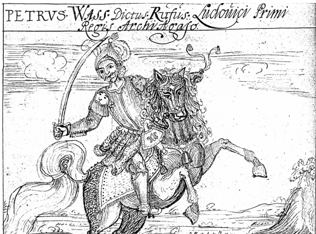
5. kép. Wass (Veres) Péter (1335–1368) allovázmester. (Husztai András: Genealogia heroica 29 v )

A felsorolt adatok tanúsága szerint tehát a testvérek kihasználták a familiaritásban rejlő lehetőségeket. Elsősorban a 14. század leghatalmasabb családja, a több fontos kormányzati tisztséget betöltő Lackfiak révén jutottak tisztségekhez szerte az országban, Ugocsától le Szerémségig, mert az úr érdekeinek szolgálata – akárcsak más esetekben – nem kívánt különösebb helyismeretet. 196 Ezek árnyékában kedvező feltételeket teremtettek felemelkedésükhöz. Állásuk révén készpénzjövdelemmel rendelkeztek, de konkrét adataink e tekintetben nincsenek. Udvari lovagként ( milesként ) – legalábbis néhányan – I. Lajos udvarához tartoztak, és minden bizonnyal alkalmi feladatokkal bízták meg őket. A vajdaságot viselő Lackfiak honorja alá tartozó nemesként vagy a királyi udvar lovagjaiként 197 több, az országhatáron kívül viselt hadjáratban vettek részt, és az is nyilvánvaló, hogy igen jól értettek a fegyverforgatáshoz. Fontos megjegyezni, hogy a Lackfiak bukása után a Wassok – néhány elszigetelt esetet leszámítva – nem vállaltak familiárisként szolgálatot más nagyúri családoknál. Emiatt a szűkebb megyei keretből a 15. században már nem tudtak kilépni, és nem is kerültek kapcsolatba az ország politikai központjával, a királyi udvarral.