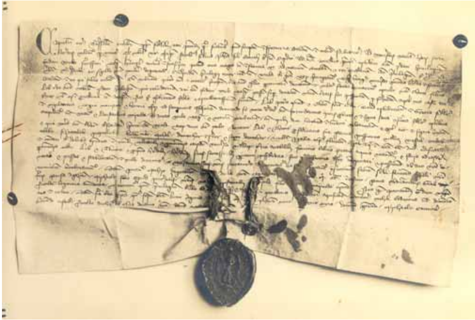
1. kép. A Wass család adománylevele (Wass cs lt [1176–1196], 1349. XII. 15-i átiratban. MOL DF 252690)