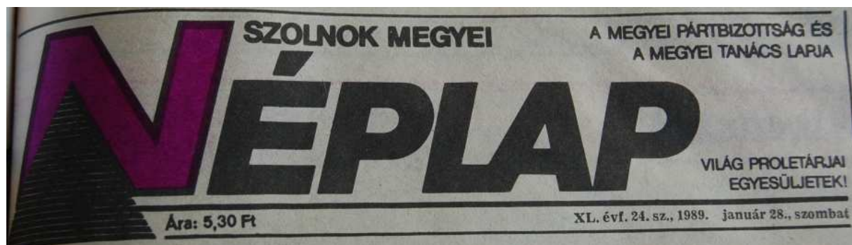
9. Ábra: Megújult főcím, 1989. január 28. 26