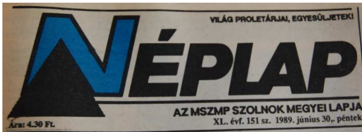
13. Ábra: A név a megváltozott alcímmel... 30