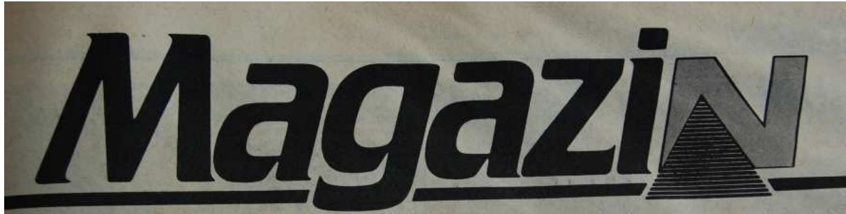
11. Ábra: A „Magazin” melléklet főcíme 28