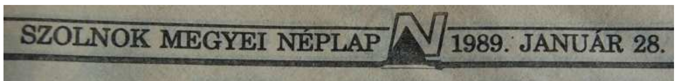
10. Ábra: Az 1989-es évfolyam fejléce 27