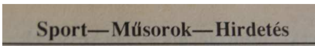
25. Ábra: Egy fejléc az újság '91-es évéből 42