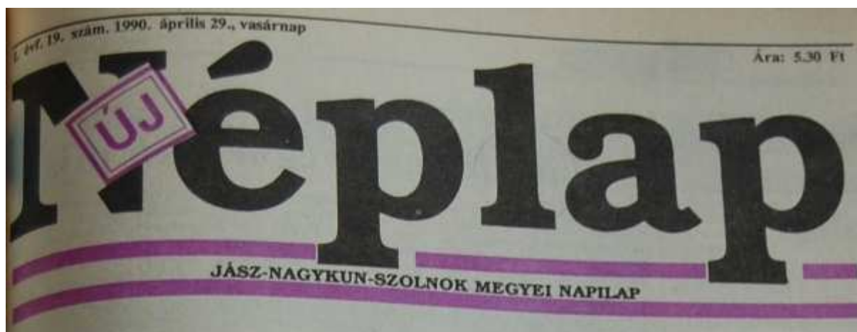
19. Ábra: A lap teljes megújulása révén 1990. áprilistól új név, új „időszámítás” 36