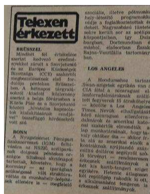
3. Ábra: A „Telexen érkezett” rovat 19