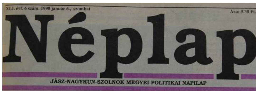
17. Ábra: Az 1990-es évfolyam főcíme... 34