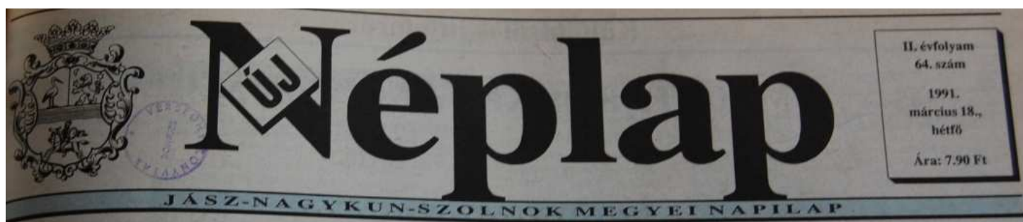
24. Ábra: Az 1991-es évfolyam címrésze 41