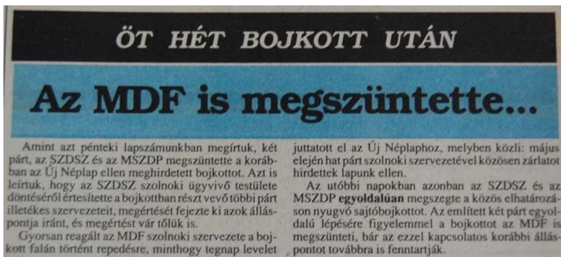
22. Ábra: ...és vége 39