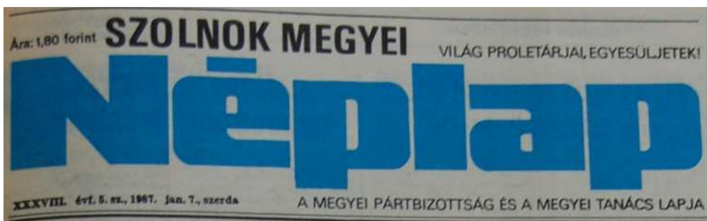
1. Ábra: A főcím 1987. januárjában 18