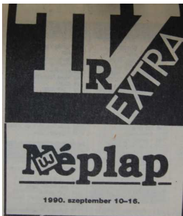
20. Ábra: A TVR Extra melléklet 37