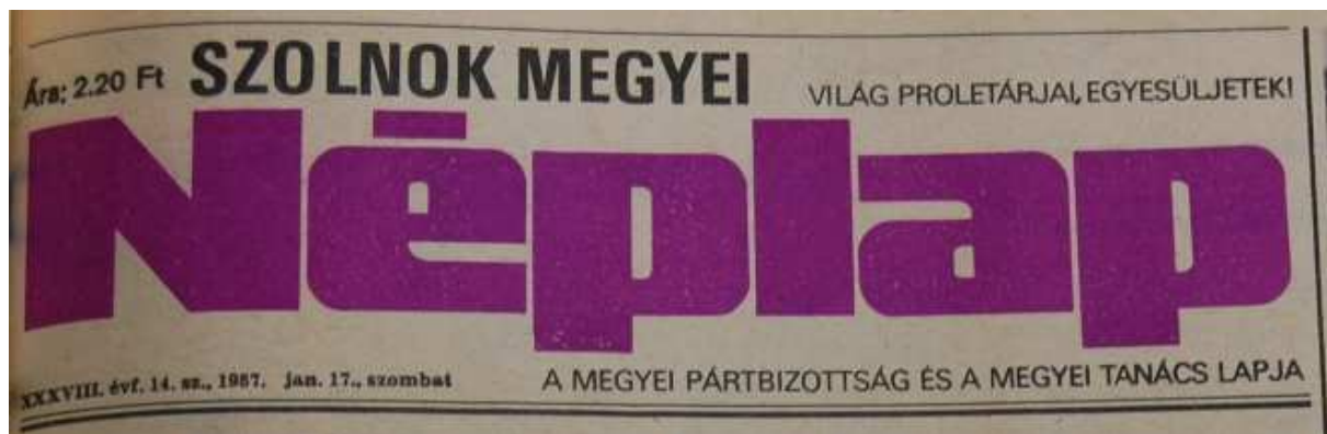
6. Ábra: Szombati lila színű főcím 24