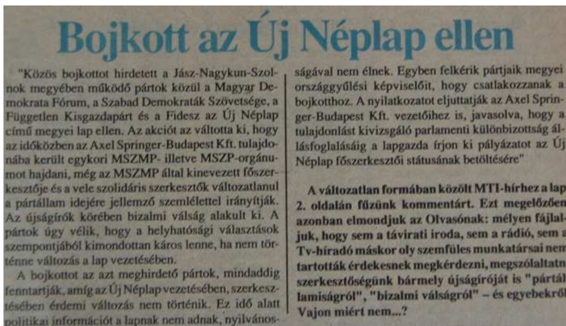
21. Ábra: A bojkott kezdete... 38