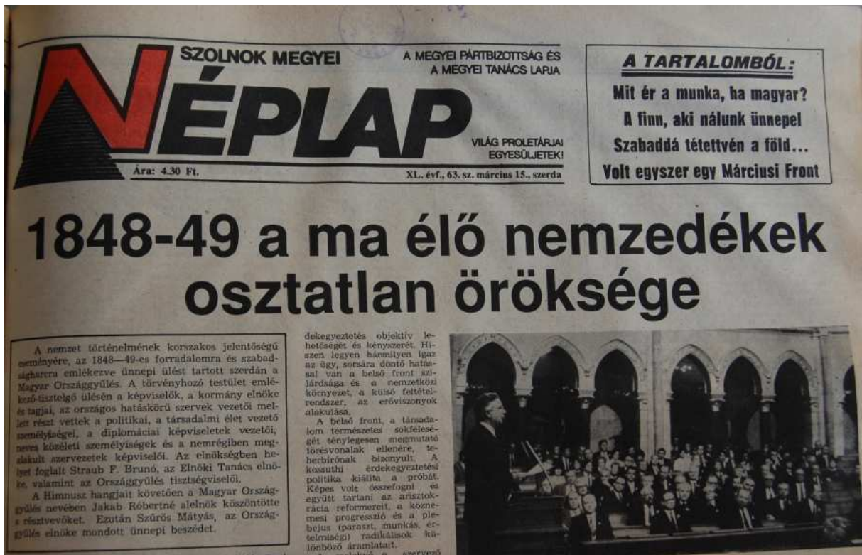
12. Ábra: 1989. március 15. 29