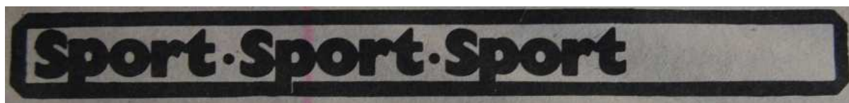
15. Ábra: A „Sport” rovat főcíme 32