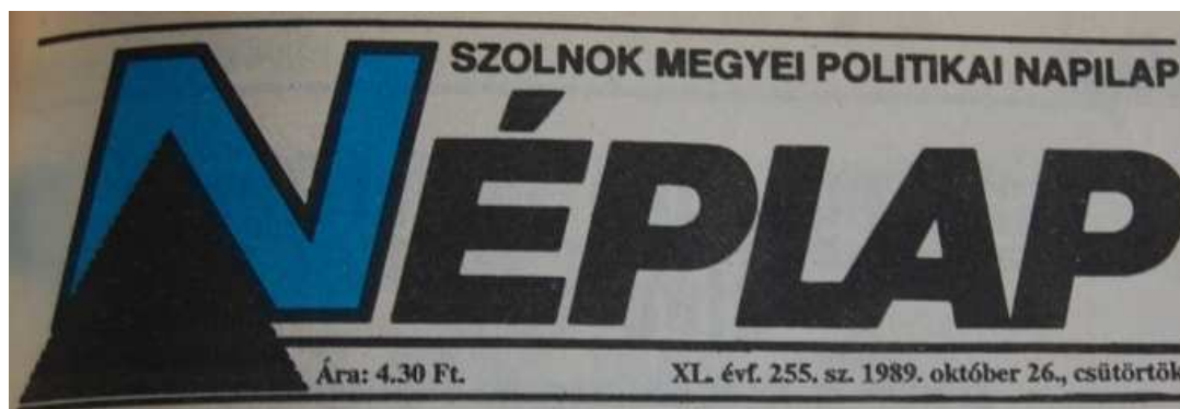
16. Ábra: A név ismét változik – 1989. október 33