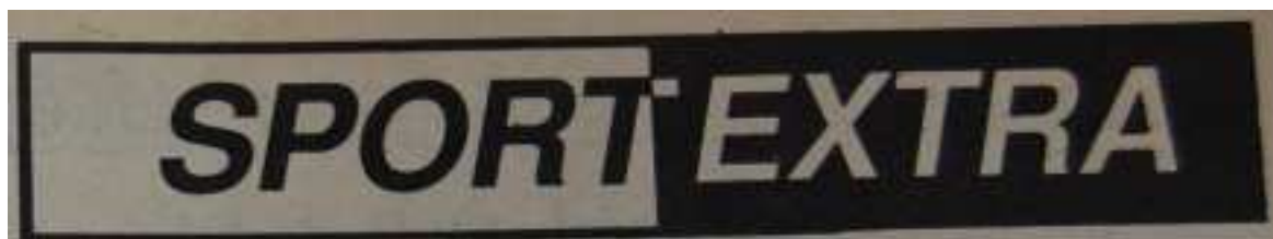
23. Ábra: A Sport Extra rovat 40