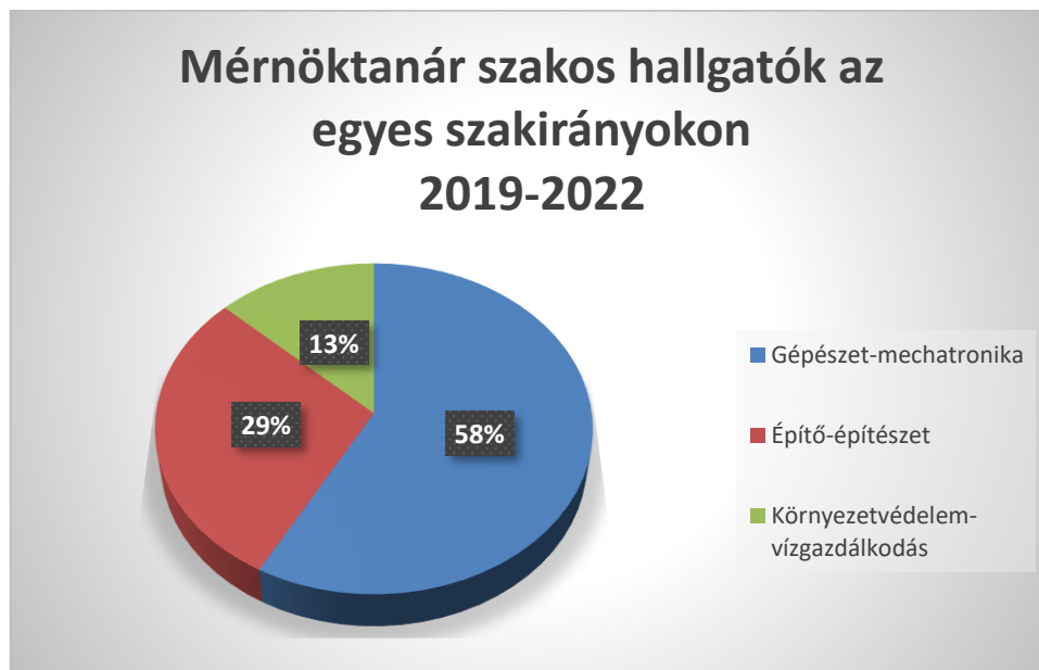
3. ábra: Mérnök-tanár szakon végzett hallgatók aránya szakirányonként, 2019-2022

IKT eszközöket számos hallgató használt, az online oktatás ezt meg is követte tőlük. A hallgatók azon tanítási óráit vizsgáltuk, ahol az oktatás hagyományos tantermi keretek között történt. A leendő mérnök-tanár taneszköz választását elemezzük a hagyományos tantermi oktatás során, különös tekintettel az IKT eszközök használatára. A mérnök-tanár- képzés jövőjére nézve hasznos a digitális eszközök választása kapcsán történő tapasztalatok összegyűjtése [3].