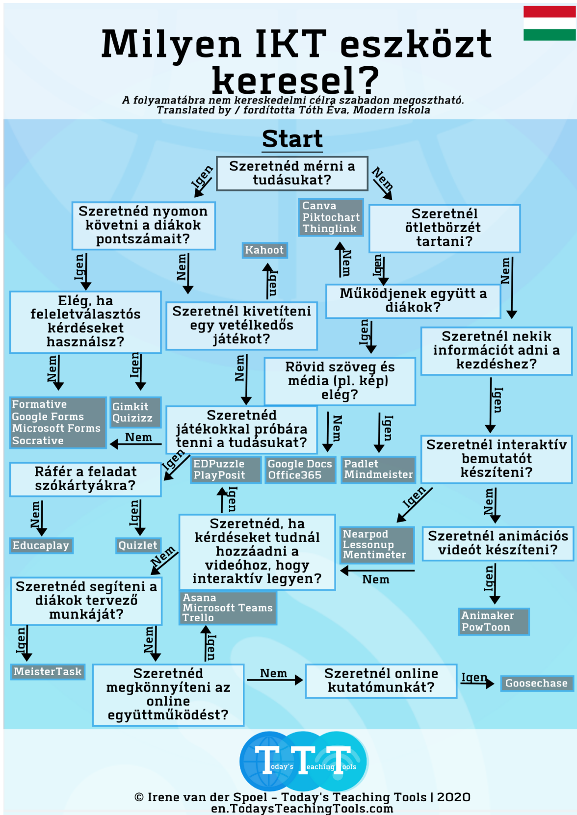
2. ábra: Eredeti kép: Irene van der Spoel | Today's Teaching Tools (Forrás: [1])