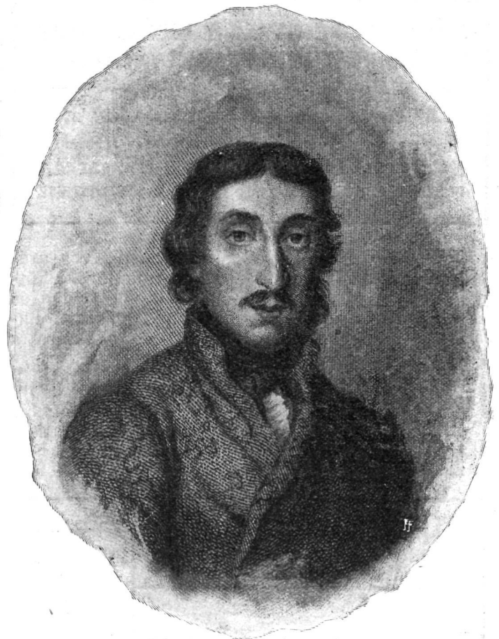
CSOKONAI VITÉZ MIHÁLY.