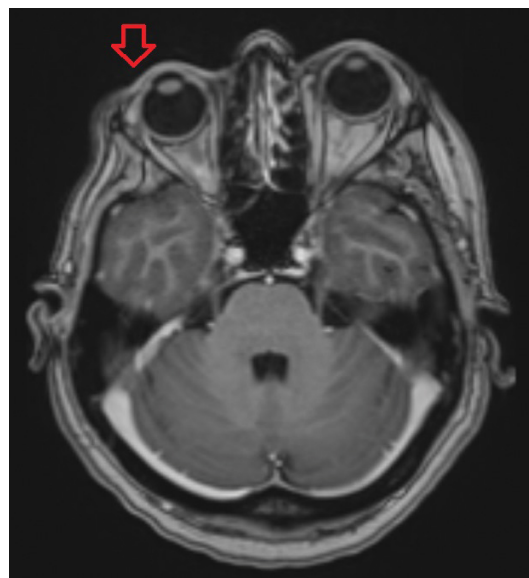
3. ábra | MR: enophthalmus (piros nyíl) MR = mágneses rezonancia

Mivel előrehaladott Parry–Romberg-szindrómában (PRS) az immunszuppresszív kezelésre nincs meggyőző adat, a további kezelés szempontjából plasztikai műtét mellett döntöttünk. A beteg előzetesen felvilágosítottuk a zsírszövet részleges atrophiája miatt az esetleges többlépcsős műtéti megoldásról.