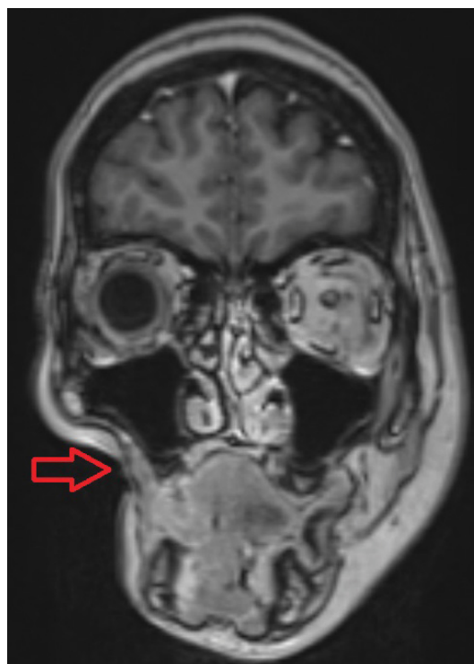
4. ábra | MR: cutis, subcutis, illetve izom elvékonyodása; csontdestrukció nincs (piros nyíl)