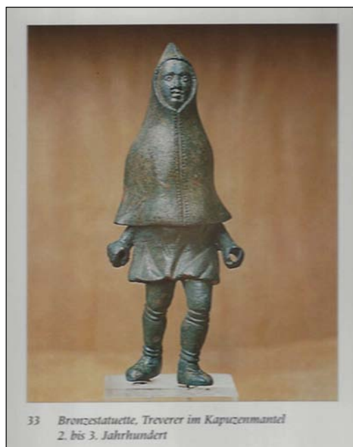
KÉP 2 Bronz szobrocska egy csuklyás köpenyt viselő treveri emberről Trierben.