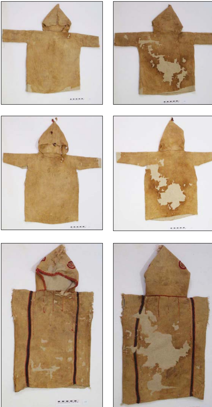
KÉP 4–9 Az antinopolisi feltárástól származó gyerektunikák hasonló szabásmintát követnek.