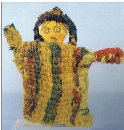
KÉP 3 Egy báb a καρακάλλιον -hoz hasonló ruhába öltöztetve (vö: C. Fluck: „Ägyptische Puppen aus römischer bis byzantinischer Zeit.“ In: Gedenkschrift Ulrike Horak . Firenze 2004, 2. Teil, 398: lábbáb tunikával, ehhez lásd kép XXV: „Zur Vervollständigung wurde an das Rückenteil eine kleine, heute leider stark beschädigte Kapuze angefügt“ és 399: „Vorbild für diese Miniaturkleider (= Puppenkleider) waren anscheinend Kindertuniken mit Kapuzen.“)