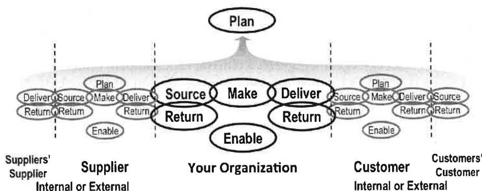
1. ábra: A SCOR-modell 6 fő menedzsmentfolyamata

Az első pillér, a folyamat modellezése keretében számos folyamatot nevesít a modell, melyek a következők: tervezés (plan), erőforrások biztosítása (source), előállítás (make), elosztás (deliver), visszarufolyamatok (return) és a támogatás (enable). Az 1. ábrán látható az előbb felsorolt hat elsődleges menedzsment-folyamat, illetve az is, hogy a modell a beszállító beszállítójától a vevő vevőjéig kiterjed az ellátási lánc egészére.