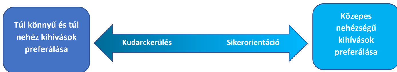
1. ábra: a sikerorientált és a kudarc kerülő személyek feladatválasztási preferenciái

Csíkszentmihályi koncepciójában kiemelt szerepet kap a kihívás-készség egyensúly, tehát az előttünk álló feladat egyfelől nem lehetetlen, másfelől elvégzése megfelelő mennyiségű erőfeszítést igényel (CSÍKSZENTMIHÁLYI, 2010). A nehézségalapú feladatválasztási preferenciák egyértelműen különböznek a teljesítménymotiváció különböző szintjei esetében. Egyfelől az alacsony teljesítménymotivációjú személyek azokat a feladatokat részesítik előnyben, melyek a nehézség spektrumának két végpontján találhatók. Ezt a kudarc kerülésének igénye okozza, hiszen egy könnyű feladatot nagy valószínűséggel lehet sikeresen teljesíteni, míg egy nagyon komplikált kihívás esetében a siker valószínűtlen, így a kudarc megítélése is ennek tükrében változik (CARVER – SCHEIER, 2006). Velük szemben a magas teljesítménymotivációjú személyek a közepesen nehéz feladatokat kedvelik. A közepes szintű megmérettetés olyan kihívást jelent, mely erőfeszítést és viszonylagosan magas szintű képességeket igényel, de nem lehetetlen a teljesítése (CARVER – SCHEIER, 2006).