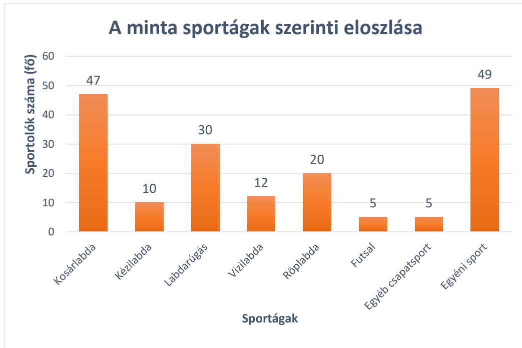
2. ábra: A minta sportágak szerinti eloszlása (saját forrás)

A vizsgálati minta 178, igazolt és egyetemi hallgatói jogviszonnyal rendelkező sportolóból, 80 férfiből és 98 nőből állt. A minta arányos eloszlással jellemezhető versenyzési szintek szempontjából is, mind a sportágakat, mind a versenyzési szinteket tekintve, ezt a lentebbi ábrák is demonstrálják.