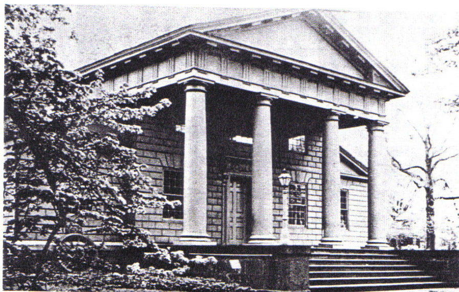
THE REDWOOD LIBRARY, NEWPORT, RHODE ISLAND, ERECTED 1750. "THE SUBTLE INFLUENCE OF USE AND RESPECT FOR GENERAL INTERESTS WORKED VIGOROUSLY IN THE MIND OF THE DESIGNER-CARPENTER-BUILDER; THERE WAS A SENSE OF FITNESS, A GRAVE POWER, AND AN ENGAGING SERENITY IN THE STRUCTURES ERECTED BY THEIR HANDS" (CHARLES A. BEARD)

Harrison, a gyarmatok két képzett építészének egyike és, a hagyományoknak megfelelően tanítványa, Sir John Vanburgh által tervezett épület a görög stílus kiváló példája. Habár fából építették, az épület, amelyet bővítettek időnként, még mindig áll – a legrégebbi könyvtári épület az Egyesült Államokban, amelyet folyamatosan használnak felépítése óta.