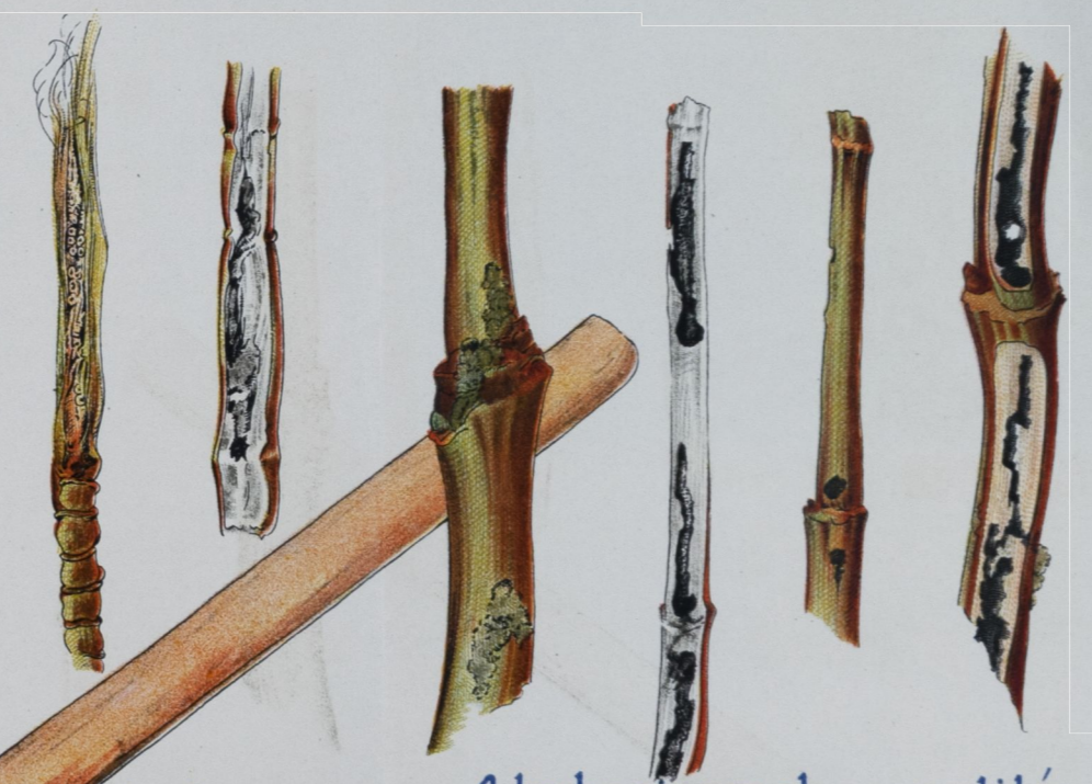
A kukoricamoly pusztítása