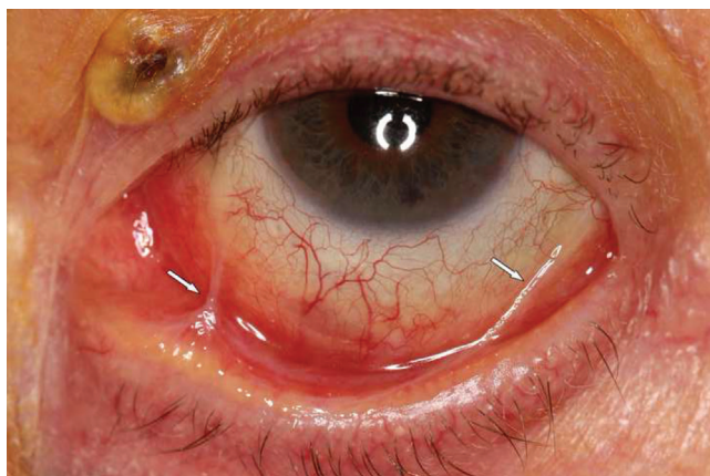
4. ábra | Vékony conjunctivaredő (nyíl) a kezdődő symblepharon jelként

Klinikailag jellemzőek a száraz szem tünetei. Majd kialakul a conjunctiva hyperaemia mind a bulbaris, mind a tarsalis részen, ezt követi a plica semilunaris elsimulása, a subepithelialis fibrosis. A fibroticus szövet zsugorodik, a conjunctivakettőzetek vongálják a szemhéjat, a kezdődő symblepharon első tüneteit mutatva (4. ábra). A folyamat progressziójával a könnymirigy kivezetőcsövei és a ductus lacrimalis nyílásai hegesednek, elzáródnak. A hegesedés fokozódásával az áthajlások megrövidülnek, kialakul a sym- és ankyloblepharon következményes entropiummal. Már a kezdeti conjunctivalis tünetek mellett megjelennek a cornealis tünetek is: LSCD, limbus körüli corneaereződés, hámerosiók, ulceratio, perforáció, hegesedés, másodlagos infekciók, jelentős, akár vakságig menő látásromlás. A szemhéj befordulásával a pillaszőrök a szemfelszín mechanikusan irritálják, fokozva a gyulladást. Ezeket a klinikai tüneteket jelentős szubjektív tünetek kísérik: égő érzés, idegentest-ézés, könnyezés. Kezelés nélkül, a hegesedés progressziójával száraz szem alakul ki, amely elvezet a végstádiumhoz, az egész szemfelszín keratinisatiójához.