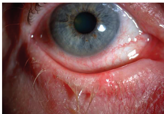
1. ábra | Conjunctivitis acuta allergica. Könnyezés, vörösség a kötőhártyán

Kétoldali kötőhártya-gyulladás, amelyre jellemző az égő, szűrő érzés, vörös szem, váladékozás, fénykerülés. A felső tarsalis conjunctiva óriás papillaris hypertrophiája gya-