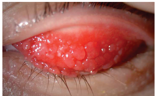
3. ábra | A felső szemhéj tarsalis conjunctivájának óriás papillaris gyulladása

Az allergiás conjunctivitisek terápiaja lokális, ebben jelentős szerepet játszanak a különféle, konzerválószer nélküli műkönyvek. Enyhítik a szubjektív panaszokat, felhívják a könnyben lévő gyulladást okozó anyagokat, kimossák a szemrésből a váladékot. A célzott terápiát az antihisztamin, hízósejt-stabilizálókat tartalmazó szemcseppek jelentik. Szerepet kaphatnak a nemszteroid gyulladáscsökkentők (NSAID) is. A krónikus gyulladások leghatásosabb terápiaja a kortikoszteroid. Krónikusan fennálló, allergiás gyulladásokban a szemcseppben adott ciklosporin alkalmazható [3]. Az óriáspapillák sebészi eltávolításával a mechanikus gyulladást kiváltó tényező megszüntethető. Az allergiás conjunctivalis gyulladások immunpatológiá-