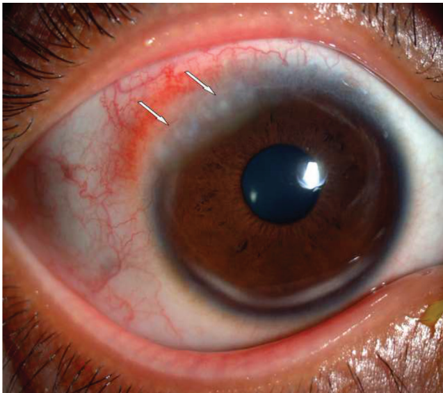
2. ábra | Trantas-csomók (nyilak) a cornea perifériáján

kori tünet. A papillák gyulladást tartalmaznak: neutrophil granulocytákat, plazmasejteket, mononuclearis sejteket, eosinophileket. A cornea is érintett lehet, keratitis punctata jellemzően előfordul. A cornea perifériáján az epithelium alatt kisebb-nagyobb fehér lerakódások láthatók (Trantas-csomók, 2. ábra). Ezek a limbus közelében gyűrű alakban helyezkednek el. A Trantas-csomók mérsékeltén kiemelkedő érzett beszűrődések, amelyek főleg eosinophileket tartalmaznak az elhalt epithelsejtek mellett. Az ismétlődő gyulladásoknak komplikációik lehetnek, amelyek hosszú távon látásromlást idézhetnek elő. Ilyen komplikáció lehet az erosio corneae epithelialis, amely befertőződhet, súlyos szaruhártyafekélyt okozva. A limbalisőssejt-deficientia (LSCD) rontja a cornea reepitelizációját. Egyesek a vernalis keratoconjunctivitis komplikációjának tartják [2].