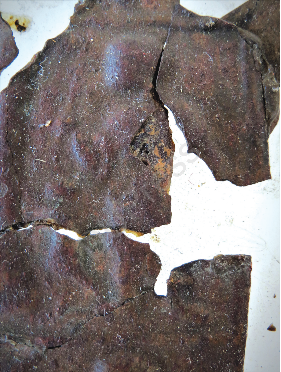
7. kép: Mózes vízfakasztása, részlet