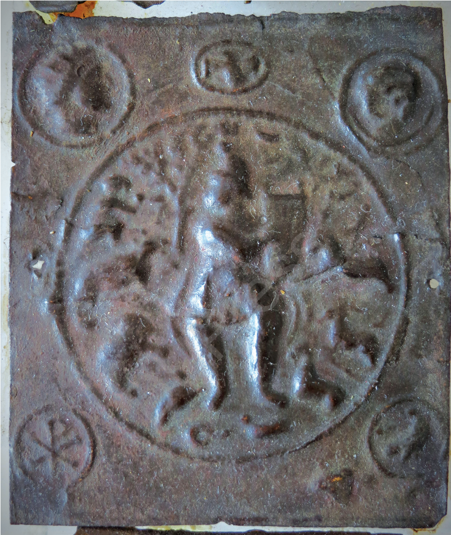
12. kép: Az állatoknak zenélő Orpheust ábrázoló medaillon