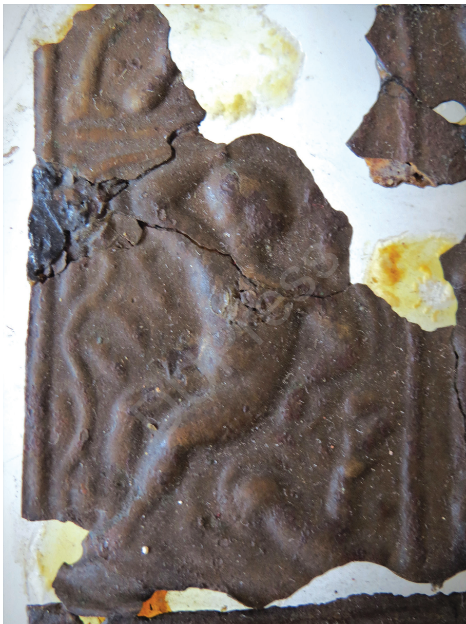
8. kép: Jónás a töklugas alatt, részlet