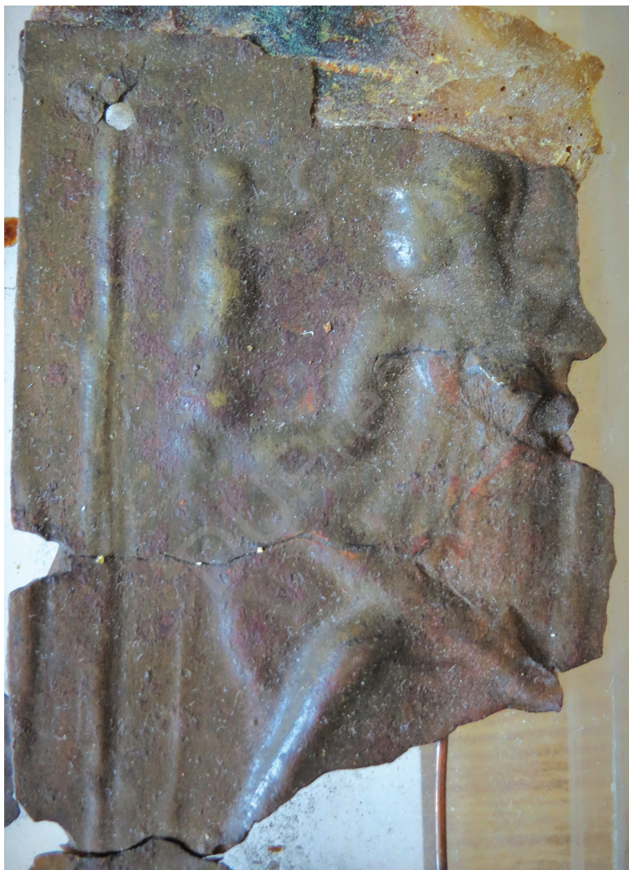
4. kép: Dea Roma, részlet