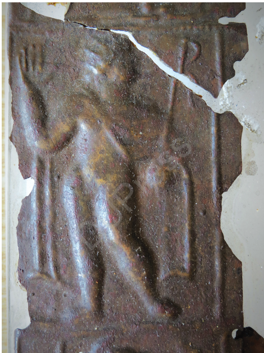
5. kép: Sol Invictus, részlet