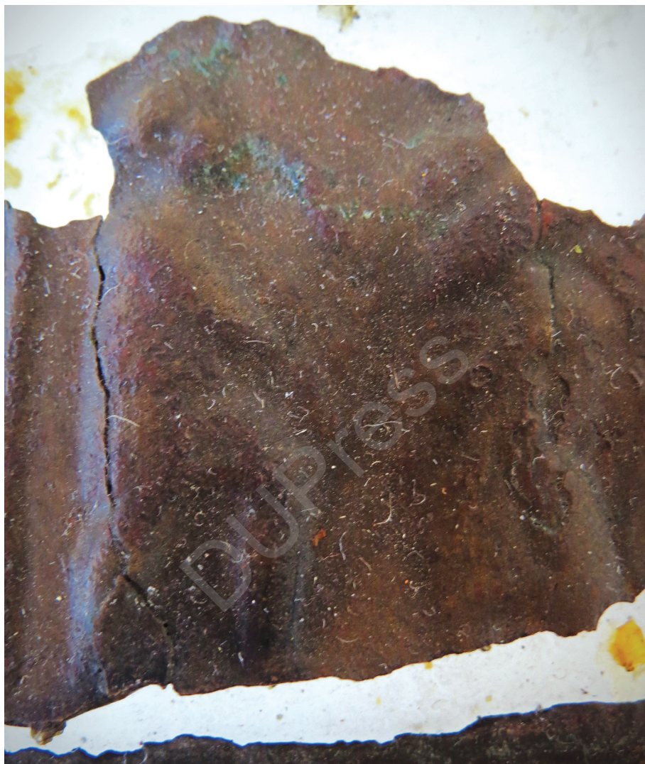
10. kép: A vak meggyógyítása, részlet