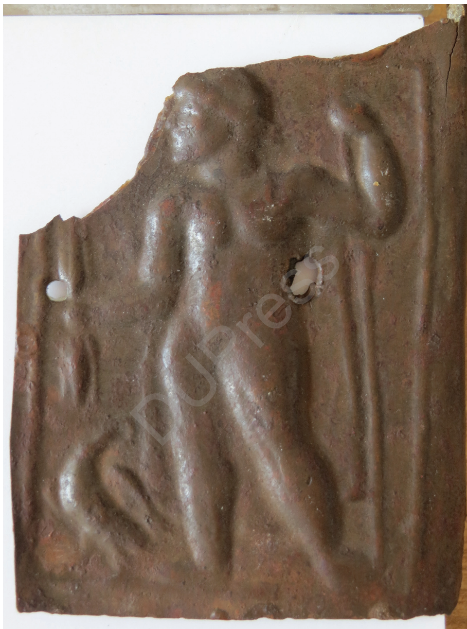
2. kép: Iuppiter Tonans, részlet