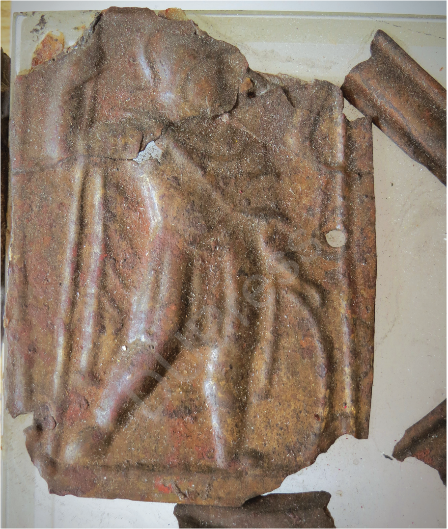
3. kép: Mars Ultor, részlet