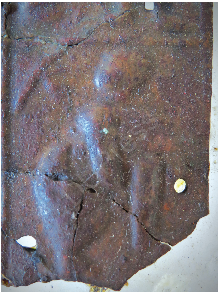
6. kép: Szandálját leoldó Mózes, részlet