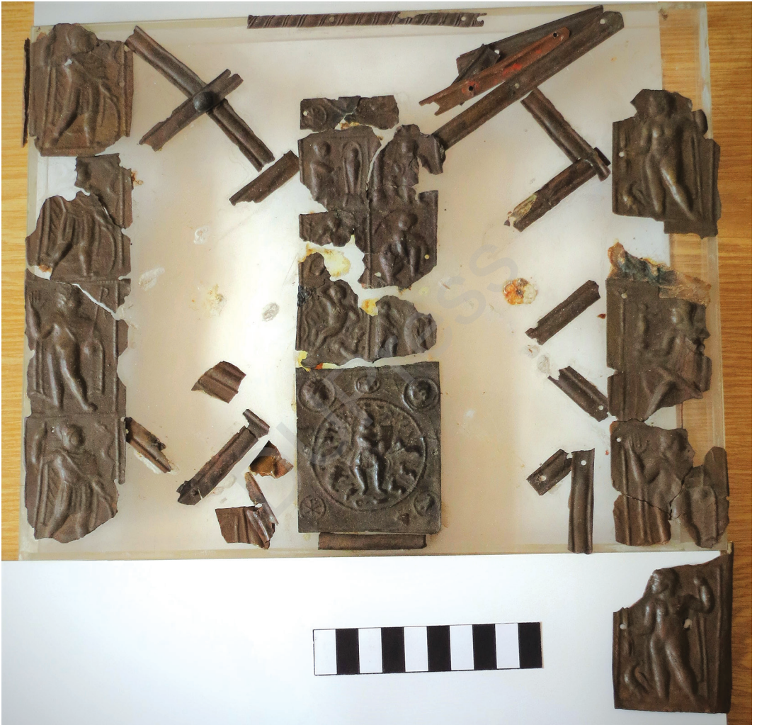
1. kép: Az intercisai Orpheus-ládika veretei (eltári szám: MNM 64.1903.19-24; IM 70.1023.2;)