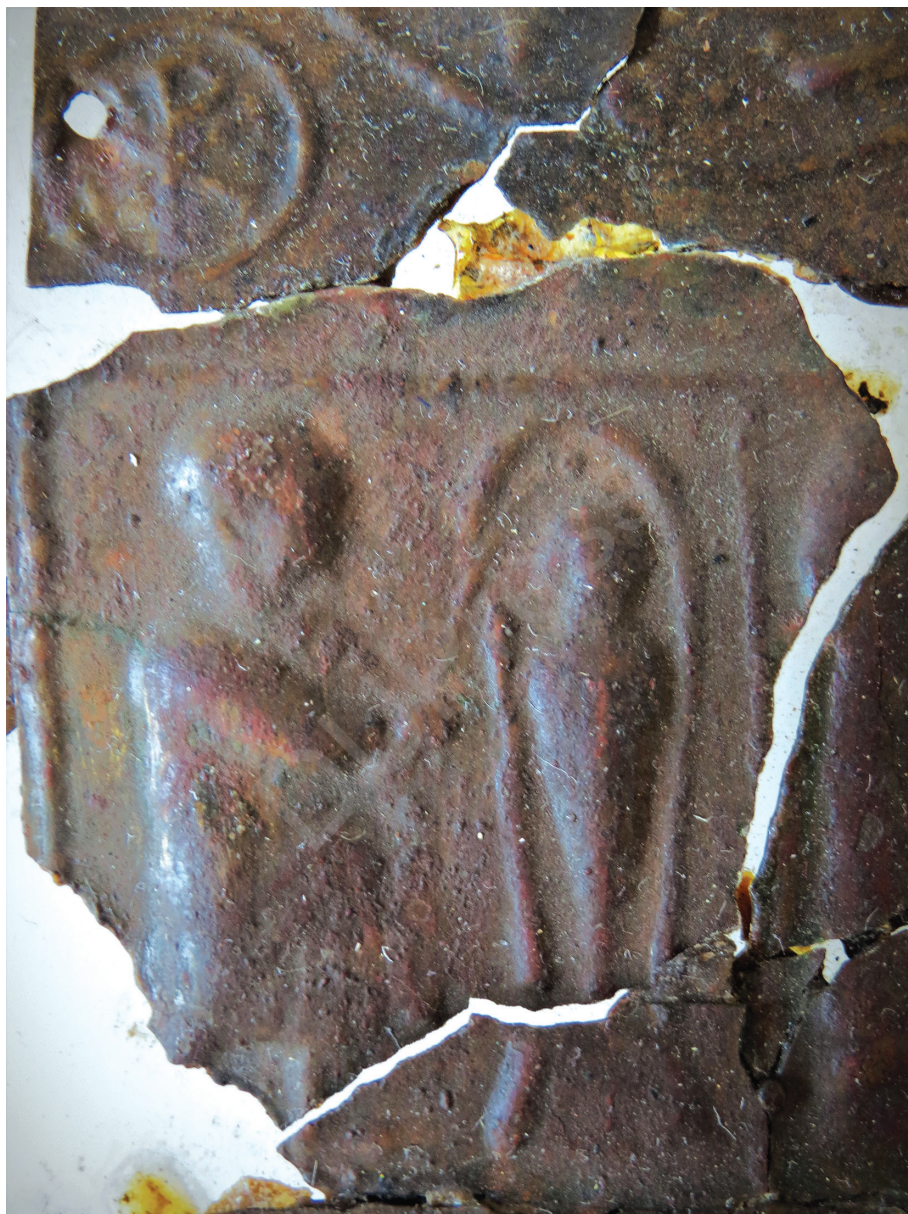
11. kép: Lázár feltámasztása, részlet