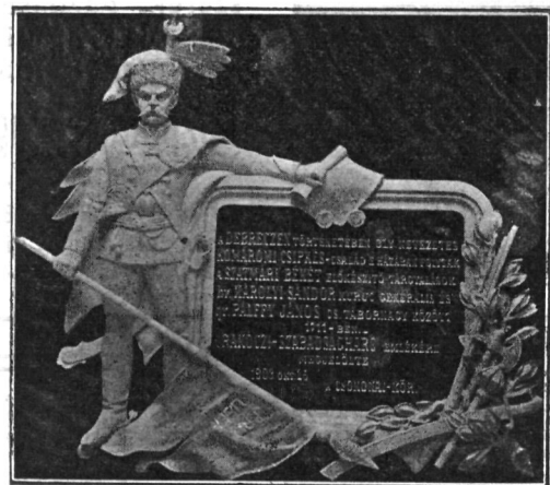
A lebontás alá kerülő Komáromi ház emlékkplakettje a szatmári békekötést megelőző tanácskozásookról (Tótn András műve).