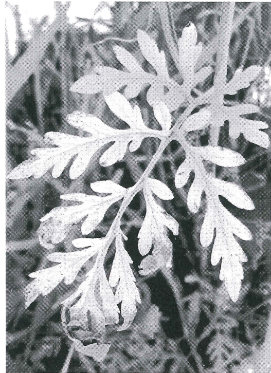
Figure 1: Leaf necrotic lesions on common ragweed ( Ambrosia artemisiifolia ) caused by a Phoma -like fungus

A fitopatogén kórokozó megjelenését súlyos esetben a levélzet és a szár, így a teljes növény elhalása követte, ezért megfigyeléseink alapján érdemes lehet a kórokozó további vizsgálata biológiai ágensként parlagfű ( A. artemisiifolia ) ellen.