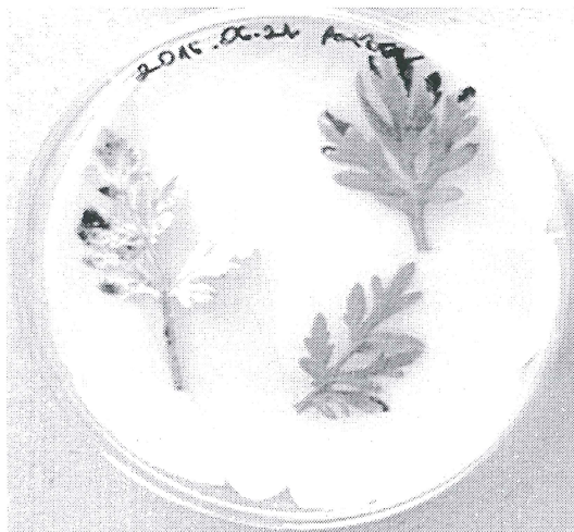
Figure 2: Common ragweed ( Ambrosia artemisiifolia ) leaves in wet chamber infested by Phoma sp.

Az izolált gomba patogenitására tünetmentes parlagfű növények mesterséges inokulációja révén győződünk meg, ugyanis a nekrotrof kórokozók esetén a Koch-féle posztulátumoknak megfelelően a fertőzés létrejött és a gomba reisolálása is szükséges.