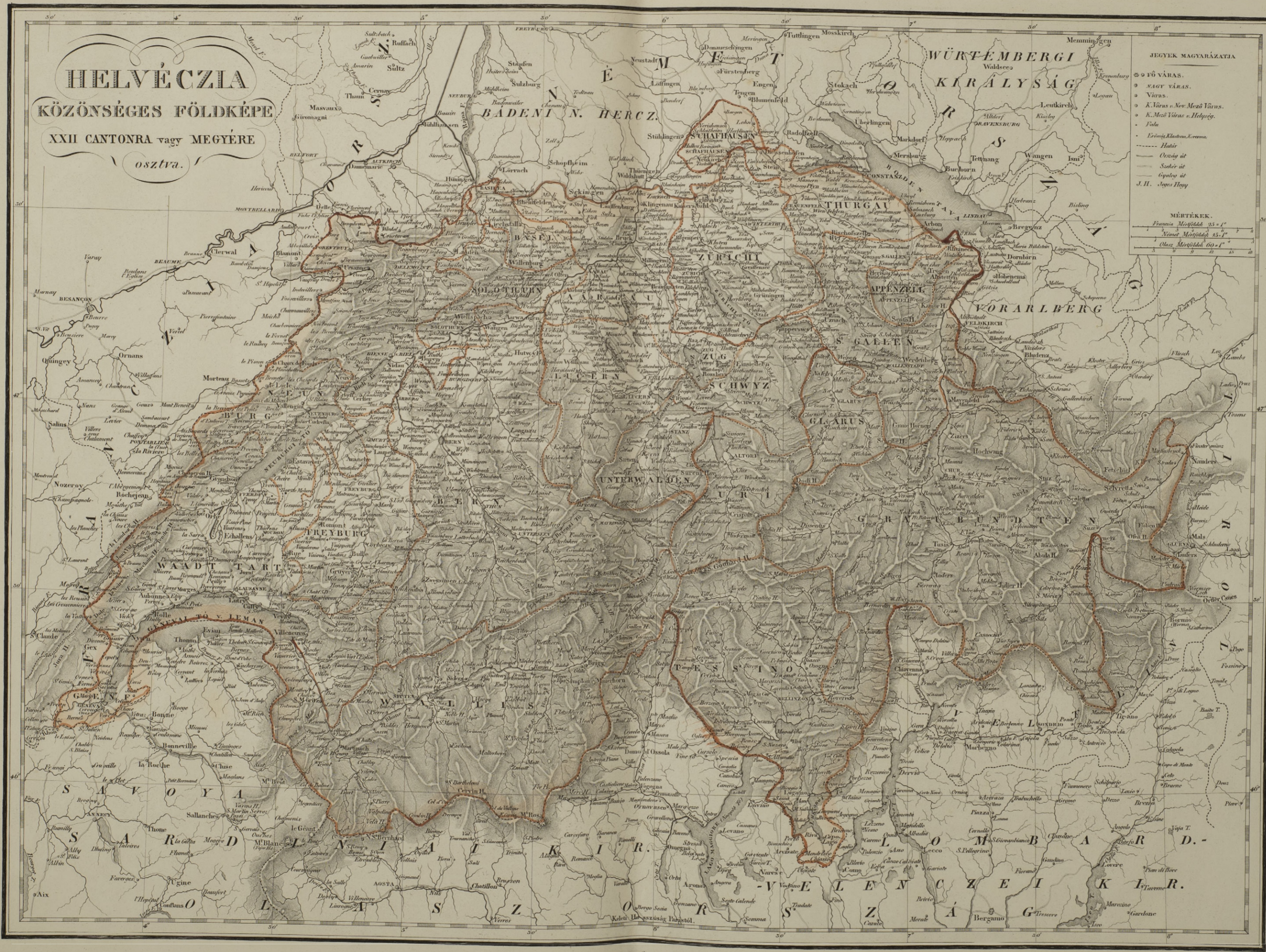
Kiadja: Neumann Neumann, Pesten 1864.