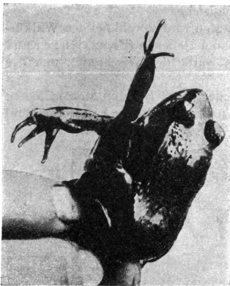
6. ábra. Passiv hajlítás C könyök ízületében. Reflektorikus nyújtás A és B könyökén.

a heterogen ideggenerátorról ezen lehetőség ellen szólnak. Ugyanebben az irányban Braus , Harrison , Detwiler kísérletei is mérvadók. Eszerint specifikus innervációról morfológiai szempontból szintén nem lehet szó.