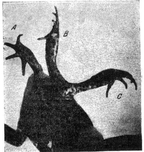
2. ábra. Ugyanaz alulról.