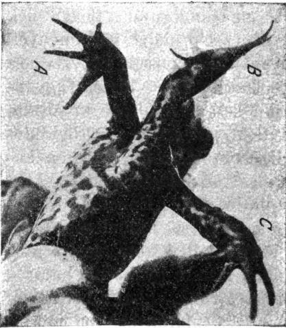
1. ábra. A három bal elülső láb. Félnyújtás.

A Magyar Biológiai Kutató Intézetbe Sólyom Lajos úr Mezőtúrról *1929 júniusában egy általa fogott, teljesen kifejlett békát küldött be ( Rana esculenta ), amelynél a bal elülső végtag mellett még két feles elülső végtag van, teljesen normális nagyságban és kifejlődésben. A két feles végtag egyike jobboldalinak, a hátulsó pedig baloldalinak felel meg. A hajlító oldalak egymás felé vannak fordulva. A normálist A, a feles kraniálist B, a feles caudalist C-nek nevezzük. Az izomzat mind a három végtagon teljesen normális, kivéve a B phalanx-izomzata. A feles végtagokat az állat mozgásaihoz abnormis állásuk miatt egyáltalán nem használhatja (1. és 2. ábra).