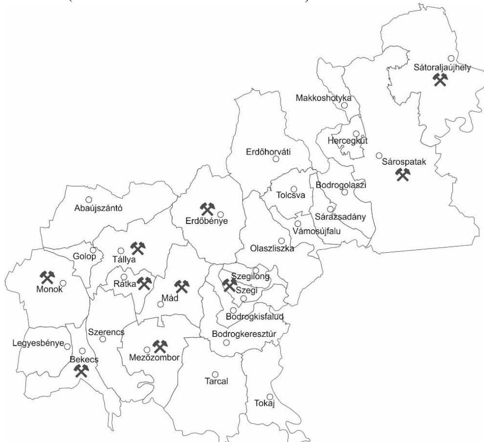
2. számú térkép: Ásványi lelőhelyek Tokaj-Hegyalján

a területen (például: kvarcit, kovaföld, kaolin, bentonit). Tokaj-Hegyalján 15 településen és 720 hektáron folytatnak bányászati tevékenységet, de Erdőbénye, Rátka és Tállya a legkiemelkedőbb. (FRISNYÁK-GÁL-HORVÁTH 2009)