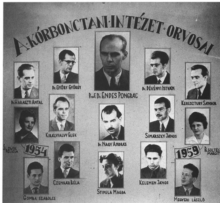
4. kép Intézeti tabló