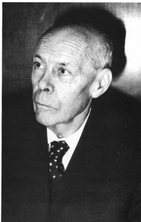
10. kép Endes professzor 80 éves