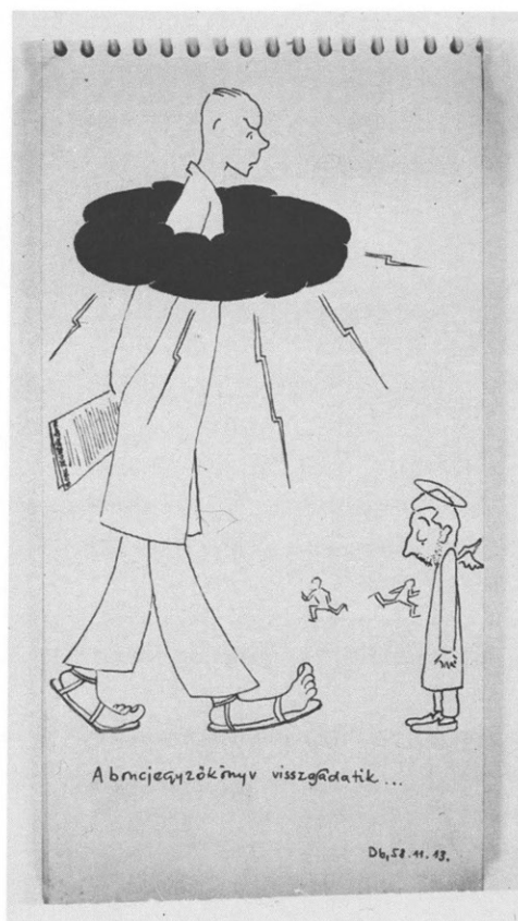
7. kép A boncjegyzőkönyv visszaadatik...