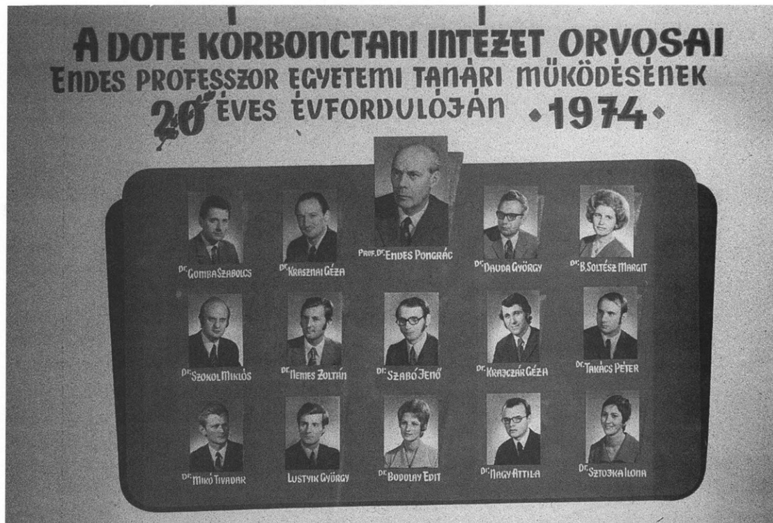
6. kép Intézeti tabló