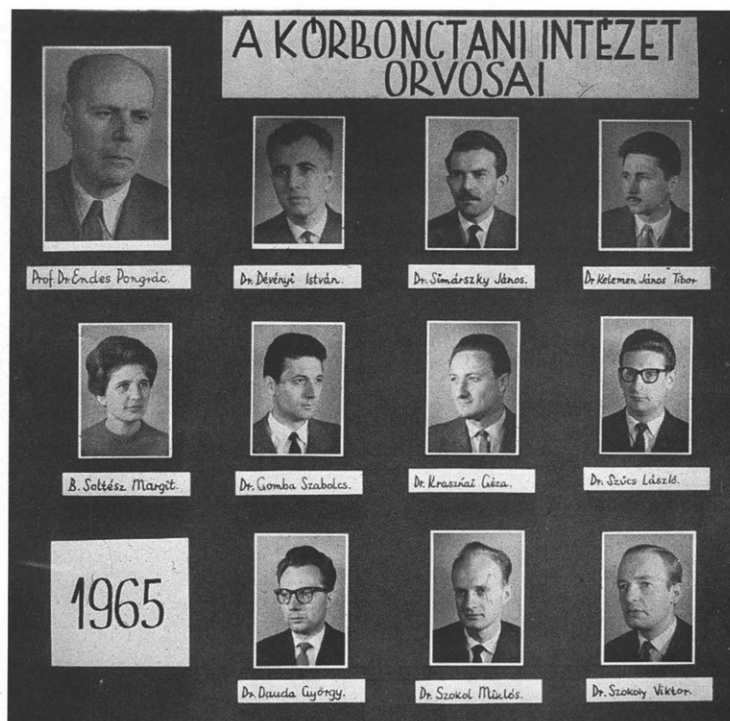
5. kép Intézeti tabló